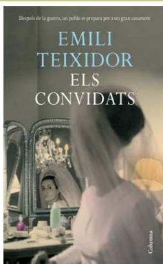
Els convidats (28/04/11)

Emili Teixidor i Vila-decàs neix a Roda de Ter (Osona), el 22 de desembre del 1933. Durant els primers anys de la seva formació coincideix amb el poeta Miquel Martí i Pol a l'escola unitària del poble, i s'inicia una amistat que perdurarà al llarg dels anys. Aquests, juntament amb d'altres joves del poble formen la "Penya Verdaguer", una mena de grup literari que es reunia setmanalment i que li despertaria l'interès per la literatura.