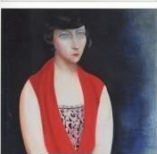
Miguel Delibes Señora de rojo sobre fondo gris

Grup de lectura. Comentem la novel·la Señora de rojo sobre fondo gris de Miguel Delibes.