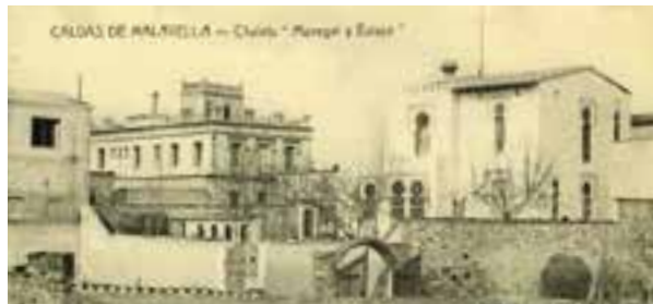
Postals on apareix la torre d'estiueig i els jardins de Can Manegat.

El Premi de Microliteratura de Caldes arriba a la seva tretzena edició. Aquesta vegada el dediquem a un escriptor, periodista i crític literari i teatral relacionat amb el nostre poble per l'activitat d'estiueig que va realitzar amb la seva família a Caldes de Malavella en el transcurs dels anys cinquanta i seixanta, a la petita caseta de Can Manegat a la pl. de Sant Grau. És en Julio Manegat i Pérez (1922-2011).