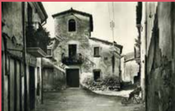
Fotografia de la plaça de Sant Grau lloc de l'estiuig dels Manegat.

i cognoms, adreça, telèfon, data de naixement). Si el text es trameta per correu electrònic cal que els treballs estiguin en un arxiu adjunt de Word sense les dades personals i amb pseudònim; les dades personals es faran constar en el cos del missatge.