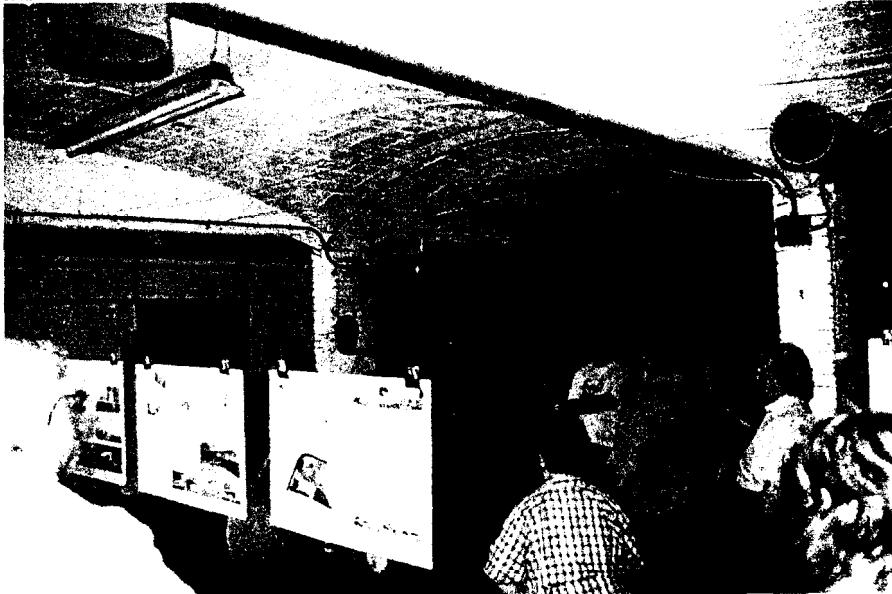
Presentació dels avantprojectes a la mateixa fàbrica.

porti a terme. Per tal d'afrontar aquesta inversió, l'Ajuntament intentarà aprofitar al màxim tantes subvencions com siguin possibles, fet que pot provocar que el projecte s'executi per fases. La ubicació del futur Centre pot definir un sector privilegiat en infraestructures públiques ja que se sumaria amb la del Col·legi Públic les seves properes ampliacions i rehabilitacions, formant un important nucli sociocultural. Tant de bo en un futur poc llunyà complint amb les promeses electorals, el veïns de Llagostera poguem gaudir d'un espai cultural ben equipat, d'unes dependències municipals dignes i d'una urbanització, la del Puig del General, com Déu mana.