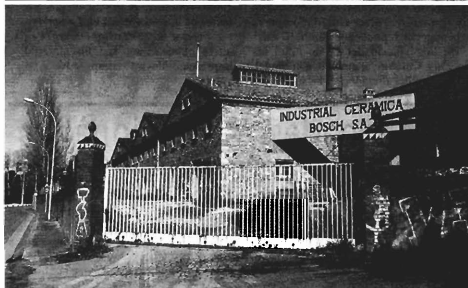
A dalt, el mas Platja que es rehabilitarà i, a baix, la fàbrica Bosch o la Catalana. / J.T.

bitatges a l'antiga fàbrica de ceràmica Bosch, també coneguda com La Catalana, i en uns terrenys adjacents, que formen part del