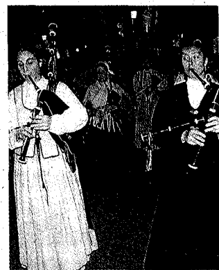
Un grup de gaiters a Lloret van retre homenatge al poble galleg.