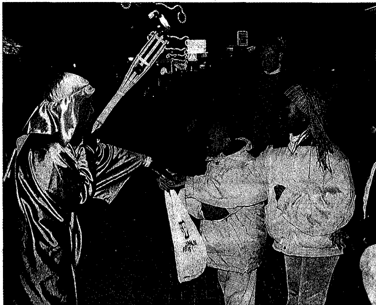
Un patge del rei negre al carrer Major de Salt donant caramels a la mainada que segula la comitiva reial, que va acabar el recorregut a l'ajuntament. / A. PUIG