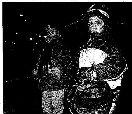
Dos nens d'Olot volent passar la comitiva de Melchior, Gaspar Baltasar, ahir a la tarda, amb els fanalets encesos.