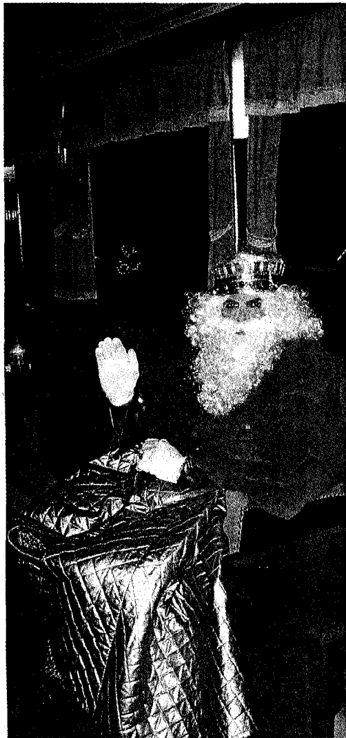
El rei blanc assegut al tren cremallera de Núria baixant fins a Querol, on es va iniciar la cavalcada. / J.M.S.