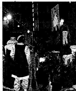
Els castellers de Figueres van rebre els Reis amb un pilar davant l'ajuntament.