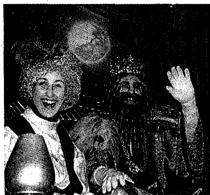
El rei Gaspar de Palamós muntat dalt de la seva carrossa acompanyat d'un dels seus patges.