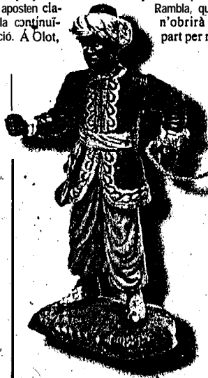
A la imatge, la figura de pessebre del rei Baltasar. El rei negre avui tornarà a portar la il·lusió a molts infants.