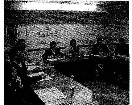
► Coordinació. Ahir, es va reunir representants de les administracions, dels Bombers i dels Mossos per coordinar-se en cas d'emergències. / M.B.