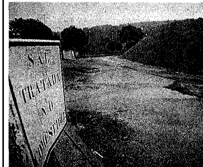
► Sal a l'autopista. En diversos punts de l'autopista, ja s'han acumulat tones de sal —a la foto la sortida Girona Nord— per precaució per les gelades.