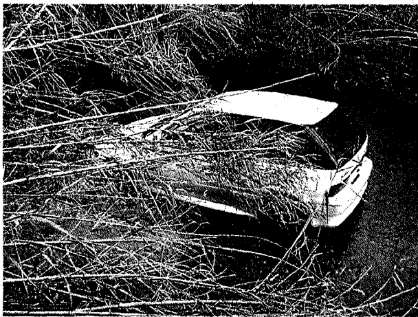
Una imatge del cotxe que va quedar atrapat a la riera de Pedret i Marçà la nit de Reis.