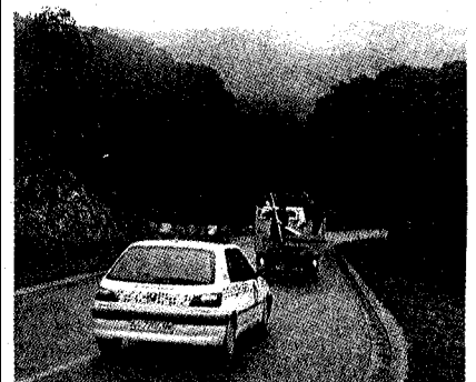
► Previsió a Platja d'Aro. L'Ajuntament de Platja d'Aro va tirar ahir sal a les pujades d'accés al Mas Nau, el punt més elevat del municipi.