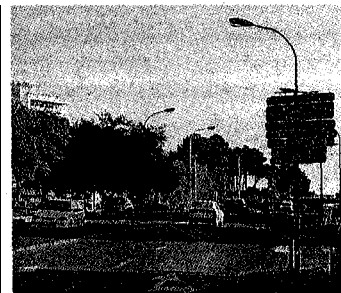
► GI-682 a Lloret, zona de Fenals. Punt altament urbà. L'Ajuntament treballa per eliminar els girs a l'esquerra construint rotondes noves i eliminant el pas elevat que hi ha al costat del cementiri.