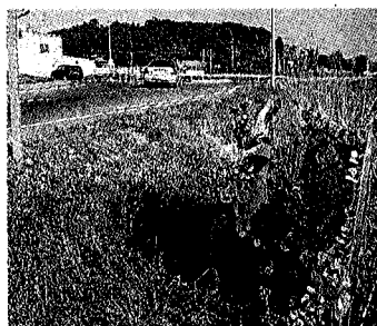
► C-31, a Vall-llobrega. La construcció d'aquest giratori a C-31, que va de Palamós a Palafrugell, i el trencant de Castell era una reivindicació que s'arrossegava des de feia molt temps.