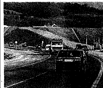
► C-36, a Llagostera. La nova intersecció a la cruïlla de la C-35 millora considerablement el trànsit a la zona i disminueix la perillositat que fins ara tenia aquest punt negre.