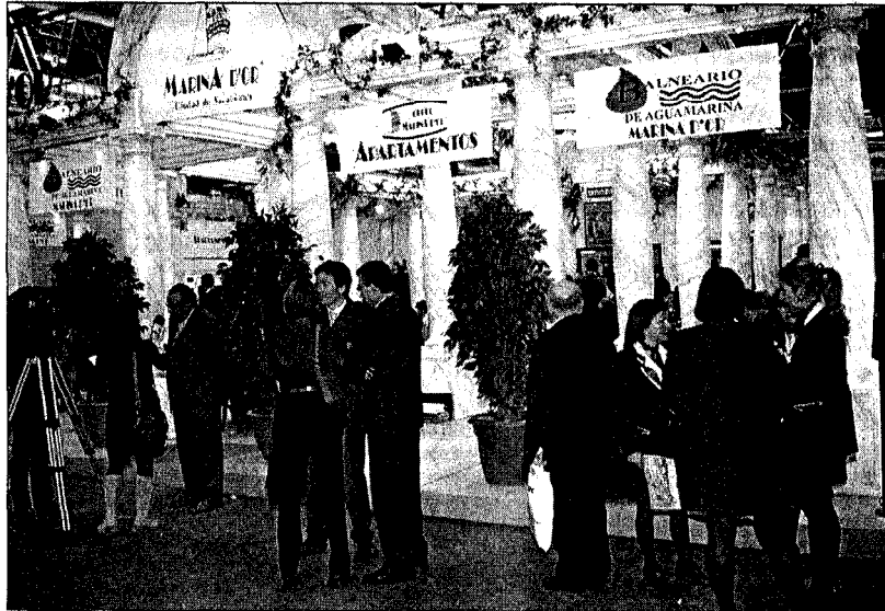
Un aspecte del Parc Firal Joan Carles I en l'edició de Fitur de l'any passat.

La presència internacional ocupa un lloc destacat en la fira. En aquesta ocasió, el paper que hi juga la presència iberoamericana es veu reforçat amb la incorporació de destinacions del Carib, Aruba i Curaçao,