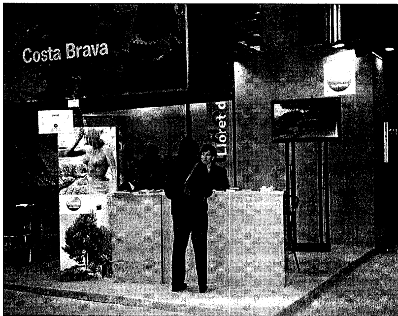
Part de l'estand del Patronat de Turisme Costa Brava Girona, en l'edició del 2002.

Segons van explicar des del patronat de Turisme, «aquesta fira internacional del turisme permet realitzar contactes entre els diferents agents turístics i, a la vegada, permet conèixer l'actualitat del sector catalunya. Per altra banda, és una excel·lent oportunitat per informar, assessorar i acostar als diferents productes –turisme actiu, golf, gastronomia, cultura, sol