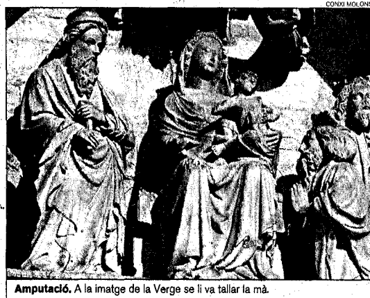
Amputació. A la imatge de la Verge se li va tallar la mà.