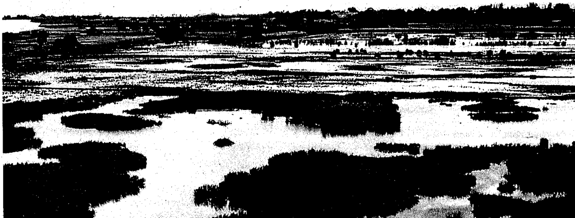
El parc dels Aiguamolls de l'Empordà ofereix imatges de gran bellesa, com aquestes.

AIGUAMOLLS, ALBERA, CAP DE CREUS, SALINES I MONTGRÍ | Fins al 24 de maig