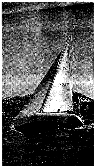
La imatge que ofereiren les regates que s'organitzen cada dissabte a la badia de Roses són dignes de postal