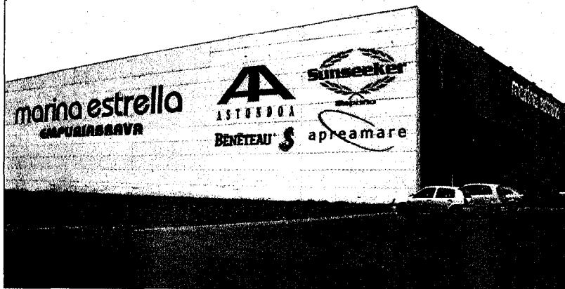
La façana exterior de les noves instal·lacions de Marina Estrella a Empuriabrava.