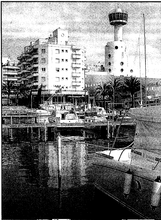
La fira del Vaixell d'Ocasió se celebra en el port d'Empuriabrava

Els visitants són gent de la comarca, de la Catalunya Nord i d'altres punts de la Península