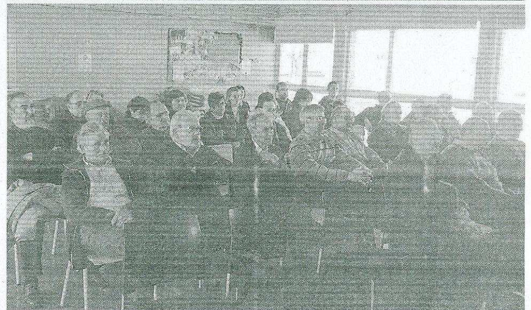
A dalt, aspecte de la deixalleria de Caldes de Malavella. A baix, un moment de la sessió informativa a Sant Jordi Desvalls.