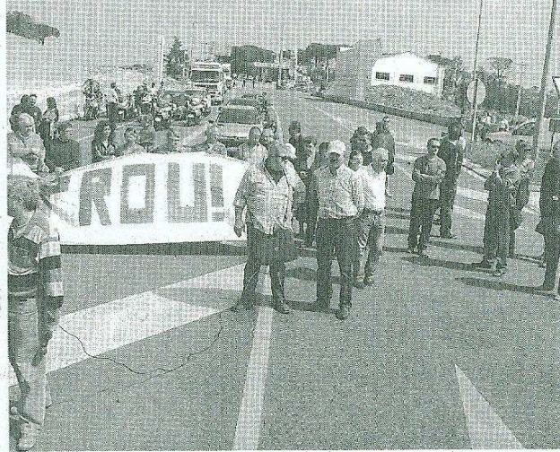
L'oposició pensa que els pegats a l'N-II s'haurien pogut assolir abans amb un govern amb «una mica d'autoritat». A la imatge, una protesta per la represa d'obres.