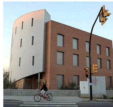
Un edifici en construcció al nucli de Caldes de Malavella. CARLES COLOMER

Els pressupostos d'enguany tenien previst que si calia el consistori podia demanar un crèdit de fins a 1,5 milions d'euros i finalment, n'ha requerit un de 920.000 euros al Banco de Crédito Local per tal de poder desenvolupar les inversions pressupostades per al 2008, com ara la reurbanització de l'Avinguda Dr Furest i la creació d'oficines per les entitats i ampliació dels vestidors del pavelló. El crèdit s'ha de retornar el 2024.