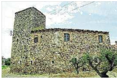
Aspecte actual d'una de les façanes del castell de Vallgornera. CONXI MOLONS

Oriol Rosselló ha posat en relleu el fet que el marquès de Sentmenat és descendent directe del primer ocupant del castell, documentat l'any 1271 i anomenat Jaume de Vallgornera. "La propietat està disposada a legalitzar l'obra i col·laborar amb Cultura".