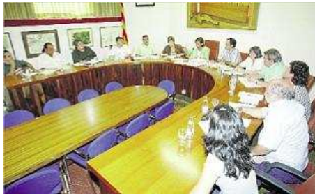
L'Ajuntament va despatxar la interventora que hi havia i el segon ha renunciat per excés de feina. diari de girona

Els canvis i els problemes amb els interventors no són nous, sinó que van començar el 2008, quan l'actual govern municipal va cessar la interventora que hi havia fins aquell moment i va canviar de lloc a la persona que realitzava les tasques de tesorera. Va ser llavors quan va contractar els dos treballadors de Blanes a temps parcial. Un temps més tard, però, una sentència va donar la raó a la interventora i en el text obligava l'Ajuntament a readmetre-la i pagar-li una indemnització de 50.000 euros. Ara, encara no s'ha fet res perquè s'espera la resolució del recurs, que caldrà veure com acaba.