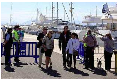
Passatgers arribant al moll del port de Roses. jordi velasco

L'interès del The World es va materialitzar fa tres anys quan un grup que es trobava a Espanya va visitar la població per conèixer les possibilitats de les instal·lacions portuàries, així com l'entorn de Roses. S'estava preparant la ruta pel món, que cada any es canvia, i per a aquest 2010 no sabem si van incloure com a alicient el sopar a El Bullí o van ser els propietaris dels apartaments qui van fer la petició. Una cinquantena dels exclusius passatgers estava previst que degustessin el menú del mundialment conegut restaurant i unes hores més tard, de matinada, el luxe salpava de Roses.