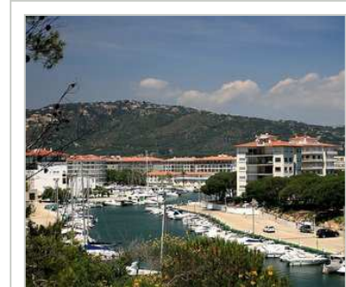
La segona fase del Port d'Aro és una de les qüestions pendents a Platja d'Aro.

La retallada de la bonificació per herència del 95% al 50% també va fer, a final de l'any passat, que CiU qualifiqués d'«insensible» el govern. Per això Giraut diu que l'equip de govern «havia generat moltes expectatives i ara té un degoteig de pèrdua de credibilitat constant».