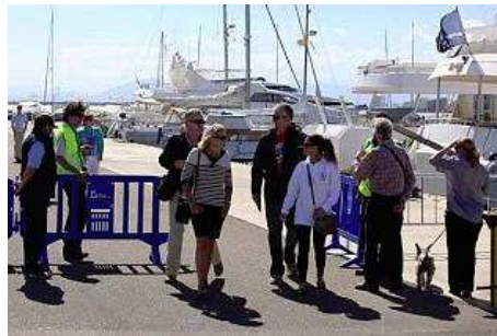
Passatgers arribant al moll del port de Roses. jordi velasco

L'interès del The World es va materialitzar fa tres anys quan un grup que es trobava a Espanya va visitar la població per conèixer les possibilitats de les instal·lacions portuàries, així com l'entorn de Roses. S'estava preparant la ruta pel món, que cada any es canvia, i per a aquest 2010 no sabem si van incloure com a alicienc el sopar a El Bulli o van ser els propietaris dels apartaments qui van fer la petició. Una cinquantena dels exclusius passatgers estava previst que degustessin el menú del mundialment conegut restaurant i unes hores més tard, de matinada, el luxe salpava de Roses.