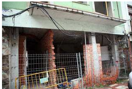
Es va haver de posar tanques davant l'edifici perquè ningú hi entrés. carles colomer

Els veïns del carrer Sorral i Francesc Camprodon van recollir 120 signatures per reclamar a l'ajuntament que actués en aquesta finca i finalment, l'equip de govern d'ERC i PSC va actuar traient la grua i ara, retirant la runa.