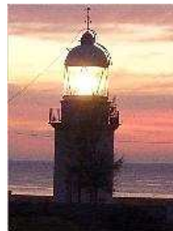
El far, en una imatge d'arxiu.