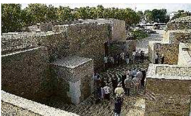
El recinte de la Ciutadella es podrà visitar també durant les nits. diari de girona

Capses... d'històries i contes és el títol de les visites nocturnes a la Ciutadella de Roses que permeten endinsar-se, a través de contes i de tastets gastronòmics, a les diferents civilitzacions que hi ha hagut, a una història que conviu en aquest recinte emmurallat des de fa 2500 anys. Les visites es porten a terme de dilluns a dijous fins al 26 d'agost a partir de les deu de la nit.