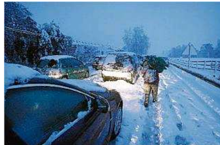
Un conductor abandona el seu cotxe a la C-65 i es posa a caminar cap a Cassà el 8 de març

Ara es planificarà un calendari d'actuacions per corregir aquestes anomalies. Aquesta revisió ha suposat per la companyia una inversió de 232.275 euros.