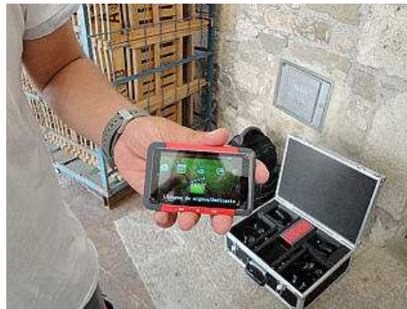
La guia digital a la mà d'un dels seus creadors ahir al matí. X.V.

Les guies digitals cada vegada són més demanades a les Oficines de Turisme. En canvi, les eines de paper s'han quedat per a un ús més literari i de coneixement més precís del territori. L'aparell digital a través d'imatge i so dona una informació puntual dels indrets més emblemàtics. Això no obstant, és suficient per poder conèixer la complexitat dels monuments del Besalú Medieval.