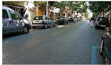
Un dels sectors d'aparcament amb zones blaves al centre de Banyoles. joan comalat

Un dels resultats d'aquesta anàlisi és, per exemple, que l'ocupació de places d'aparcament al carrer Corominas ha augmentat del 15 al 22 per cent en aquests dos últims anys.