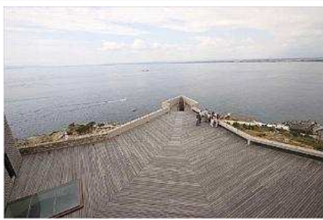
El mirador de la façana del castell de la Trinitat de Roses amb vistes a la badia. diari de girona

El castell de la Trinitat està situat a la punta que tanca la badia interior del Golf de Roses, fet que ofereix unes vistes de tota la badia a seixanta metres sobre el nivell del mar. L'estudi de la documentació gràfica de la qual es disposa ha permès conèixer el projecte definitiu del castell que va elaborar l'enginyer Luis Pizaño el 1543 i que culminava deu anys més tard. La punta nord-oest de la part alta del mur nord de la muralla i gran part de la primera plataforma van ser enderrocades durant les voladures de les tropes napoleòniques. La reconstrucció permet veure les parts noves amb materials actuals, de les que encara es conservaven.