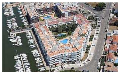
Els edificis Royal Marine, situats a la marina de Santa Margarita. jordi velasco

Els edificis Royal Marine I i II estan situats a tocar els canals de Santa Margarita. Es tracta de promocions d'habitatges, alguns on resideixen els propietaris i altres de lloguer. Consten de fins a quatre pisos d'alçada en diferents apartaments i un pati interior.