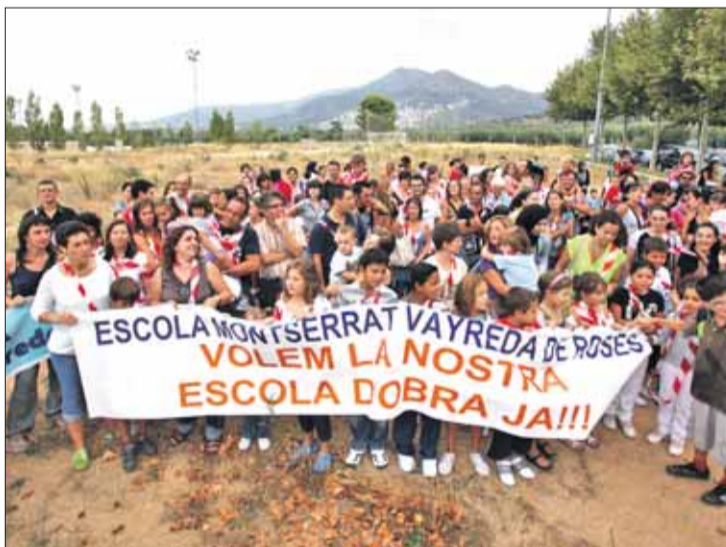
La manifestació es va fer el primer dia de curs. JORDI VELASCO

haurà nens que hauran passat tota l'educació infantil i la primària fent classes en barracons", criticava la presidenta de l'AM-