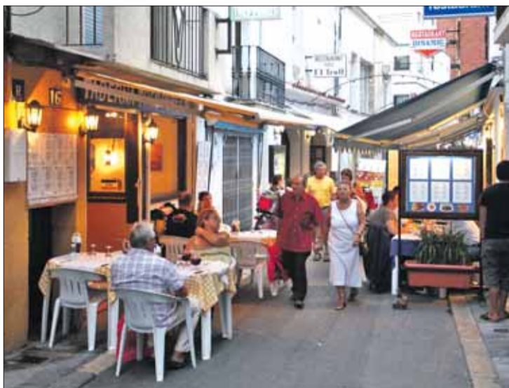
El carrer Sant Sebastià és una de les vies comercials de Roses. JORDI VELASCO

Les obres, tenen un pressupost de 577.358,04 euros i estan finançades en un 95% pel programa de l'1 per cent cultural de la Generalitat, concretament de la Direcció General d'Arquitectura i Paisatge i l'Incasòl. El 5% restant, el sufragat l'Ajuntament de Roses. El 6 de setembre passat, representants de l'administració local van organitzar una sessió informativa, a la sala de plens del consistori, per tal d'informar els veïns sobre la redacció del projecte i l'execució de les obres.