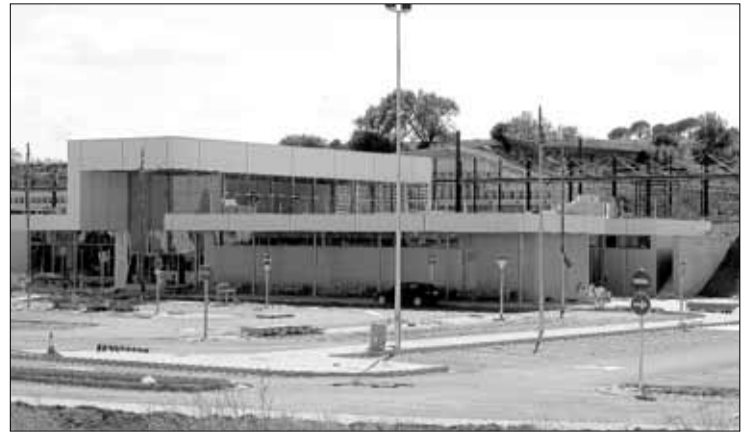
L'estat de les obres de la nova estació situada a Vilafant. SANTI COLL

tuada darrere la residència Els Arcs- amb el recinte de la nova estació, que ja disposa de l'aparcament acabat i senyalitzat i amb bona part de l'avinguda d'accés cap al carrer Ter força ben definida. La connexió amb la variant de la línia convencional que prové de Vilamalla també està en una fase molt avançada.