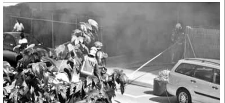
Quan es va declarar el foc, es van viure moments de tensió. NARCÍS CASELLAS