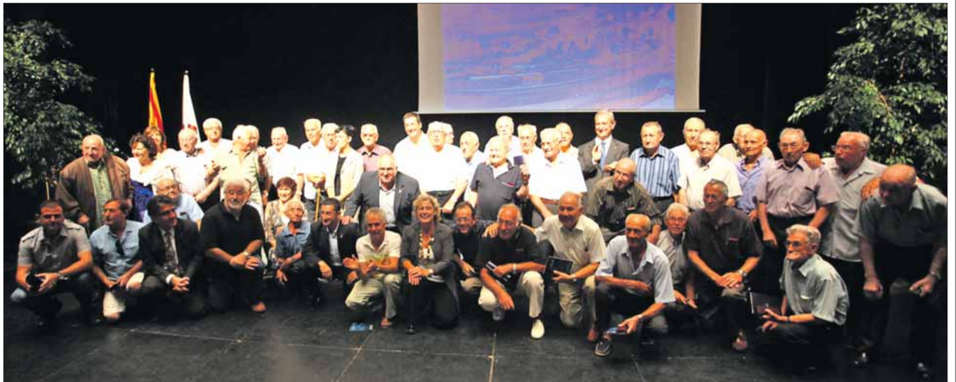
El poble de Roses va celebrar aquest diumenge passat un acte de reconeixement als pescadors jubilats per tota una vida de dedicació a l'activitat de la pesca i el mar. JORDI VELASCO