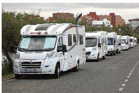
Un dels principals problemes que pateix Roses el generen les autocaravanes fora dels càmpings. jordi velasco