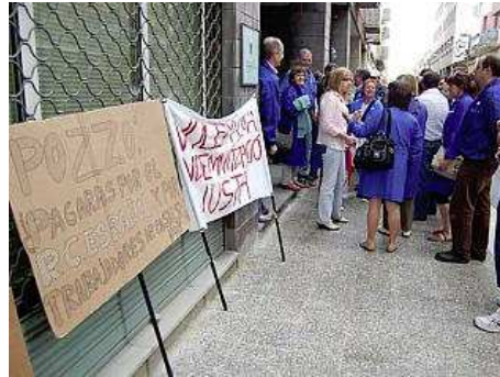
Treballadors de Tallers Casals en una manifestació amb pancartes contra els Pozzo.