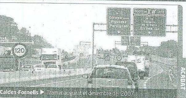
Caldes-Fornells ► Tram inaugurat el desembre del 2007