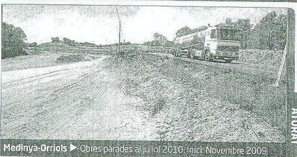
Medinyà-Oriols ► Obres parades al juliol del 2010. Inici: Novembre 2009