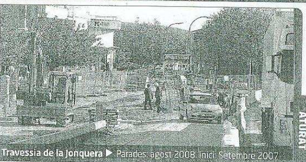
Travessia de la Jonquera ► Parades: agost 2008. Inici: Setembre 2007