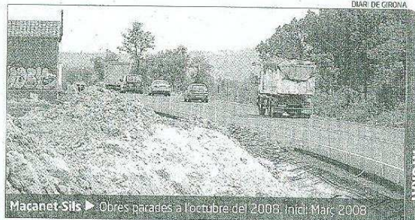
Maçanet-Sils ► Obres parades a l'octubre del 2008. Inici: Març 2008

En el seu lloc el ministre va decidir desencallar els dos projectes entre Maçanet i Caldes de Malavella. I, de fet, per a aquest 2011 l'Estat ha decidit centrar el seu esforç inversor en el desdoblament d'aquests trams de la Selva amb una inversió de 12 milions d'euros. Una partida a priori insuficient però que segons el diputat del PSC Juli Fernández serà vàlida ja que es farà gràcies al finançament publicoprivat. Aquests 12 milions són la inversió més baixa per a l'autovia Tordera-Jonquera dels últims sis anys.