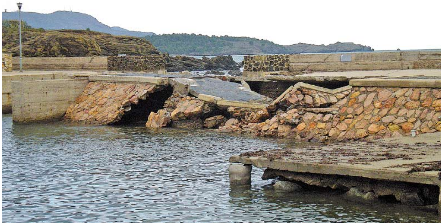
LLANÇÀ. Els embats del mar van tornar a picar fort a Sant Carles, on van provocar l'ensorrament d'un mur que hi havia en un embarcador

ROSES COMPTA 40.000 EUROS, LLANÇÀ, 60.000, I EL PORT DE LA SELVA, 20.000