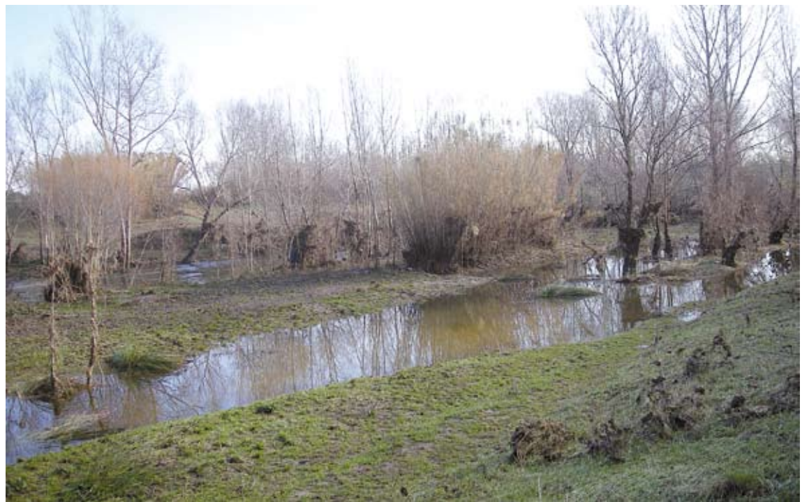
ENTREBANCADA. La Muga està plena de branques i matolls que impedeixen la fluïdesa de l'aigua