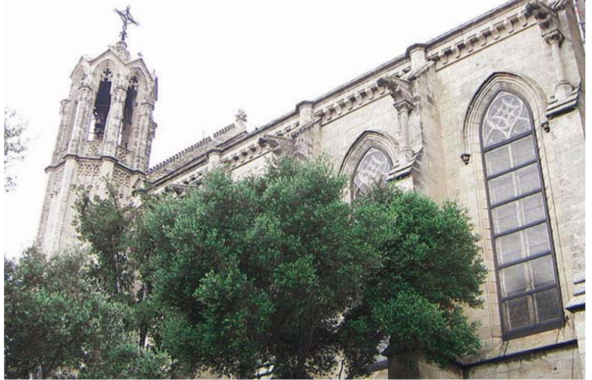
SANTA MARIA. Una imatge del temple portbouenc

que tenia com a missió finançar la instal·lació d'una coberta protectora. A partir d'aquí, va ser quan el Bisbat va decidir intervenir en l'assumpte i va encarregar un es-