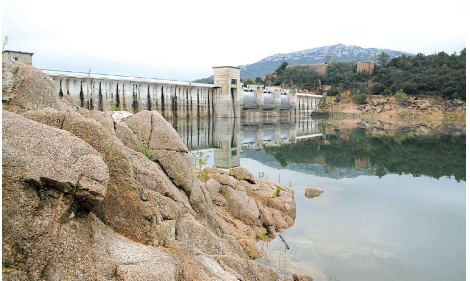
EMBASSAMENT. Aspecte que presentava el pantà de Boadella, ahir al matí, després d'augmentar la seva capacitat en prop de 24 hectòmetres cúbics d'aigua