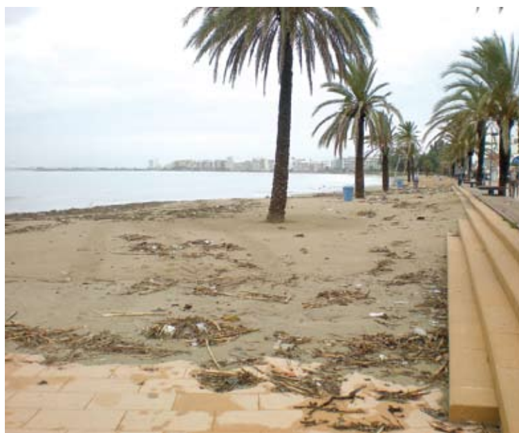
ROSES. La platja gran s'ha quedat sense sorra i ben bruta