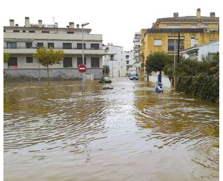
EL PORT DE LA SELVA. La riera es va desbordar i va inundar les cases