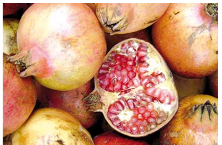
MAGRANES. Dissabte a les 10 del matí comença la Fira de la Magrana

Des de les 10 del matí i la mitjanit s'han organitzat tota una sèrie d'actes que tindran la missió d'embolcallar la magrana de Siurana, la qual es podrà adquirir en sacs (com si fossin taronges) o beure en uns sucus que es vendran a les parades de l'organització. Una quarantena de tendals d'artesania i d'alimentació delicates-