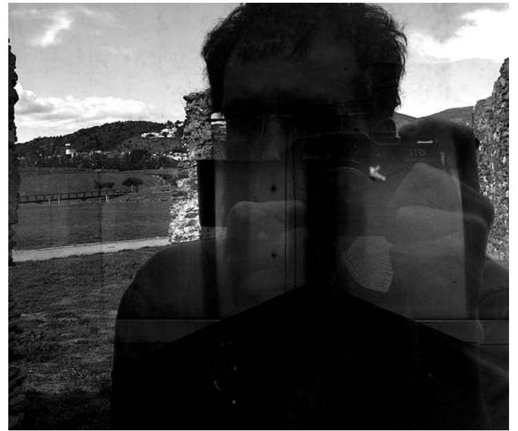
FOTOGRAFIES. El cartell amb què es publicita la mostra de Jordi Mitjà