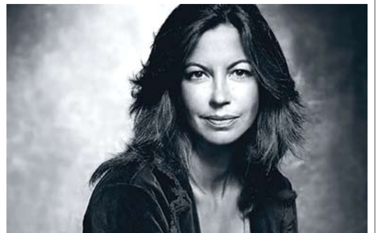
ÀNGELS BARCELÓ. La periodista serà dilluns al Teatre de Roses