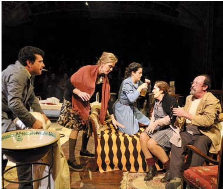
LA FAMÍLIA. Una escena del muntatge que dirigeix Oriol Broggi