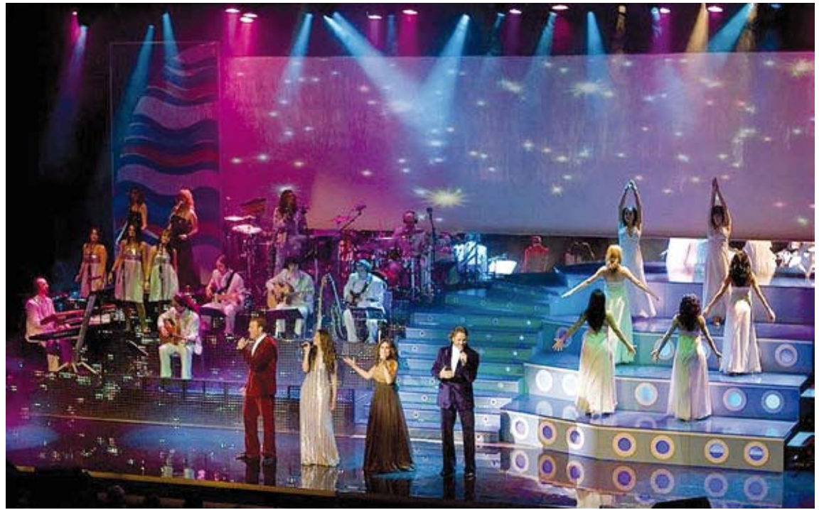
'UN BESO Y UNA FLOR'. L'espectacular muntatge és un dels grans atractius