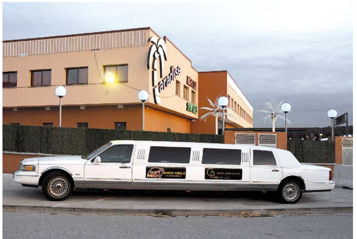
INAUGURACIÓ. Homes de diverses edats i nacionalitats van passar ahir a la nit per la primera jornada del club en actiu