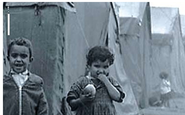
CARTELL. L'exili a debat