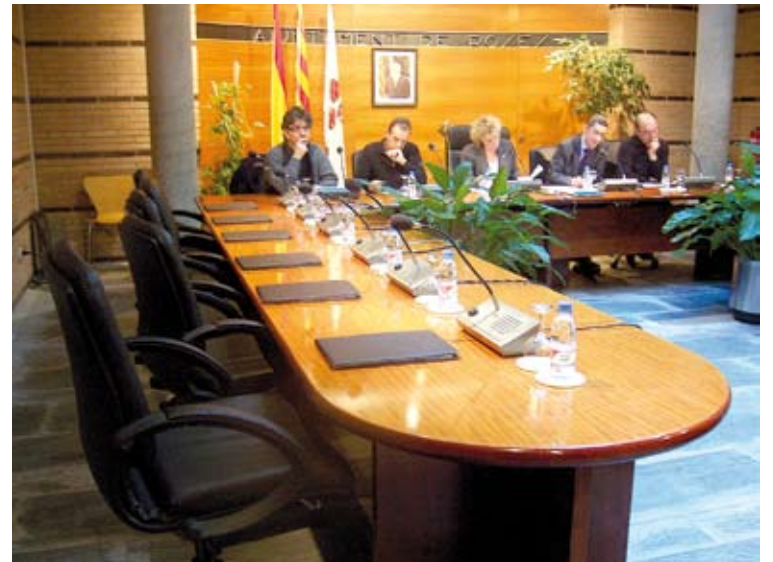
OPOSICIÓ DURA. El 2008, CiU no va anar a un ple per protestar contra el govern HN

El recurs es basa en una compra-venda "poc transparent" d'unes finques a la zona del Mas d'en Puig. CiU explica que uns terrenys es van comprar per set milions d'euros i el mateix dia, en una diferència d'hores, es van vendre per 15 milions. D'aquests, set es van pagar al comptat i els altres vuit milions d'euros a terminis. La formació assegura que no acusa, que només reclama que s'aclareixi si, realment, "aquesta plusvàlua prorratejada està subjecta a una requalificació del sòl".