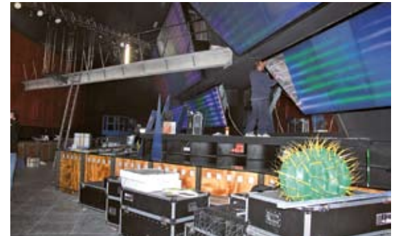
INTERIORS. A l'esquerra, el bar que uns encaputxats van cremar fa unes setmanes, i a la dreta, una de les sales