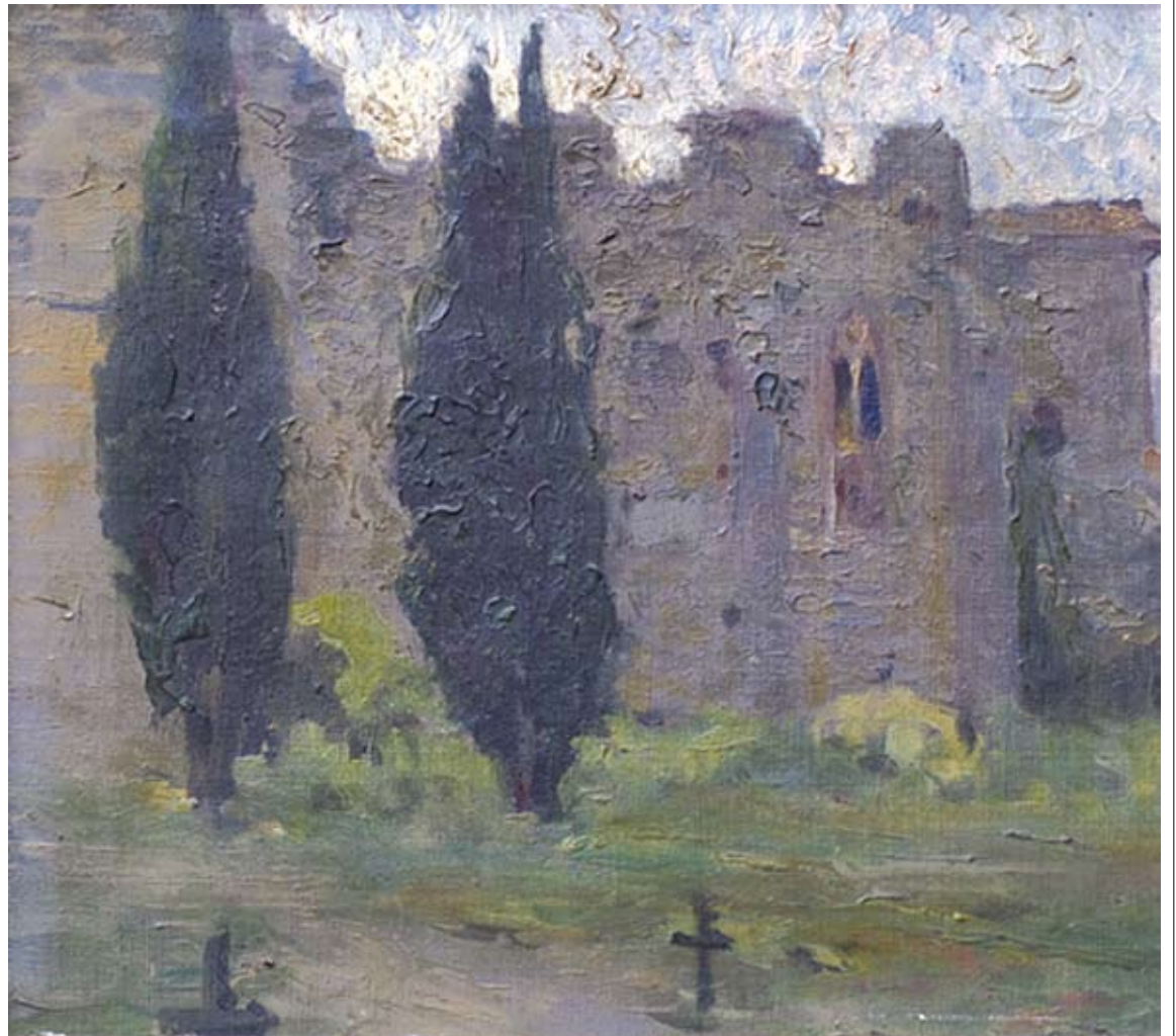
MODEST URGELL. Cementiri de Vilabertran, no datat. Oli sobre tela, 27,5 x 33,5 cm. Col·lecció particular.