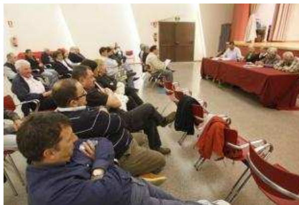
Una trentena de persones van seguir el debat dels polítics.