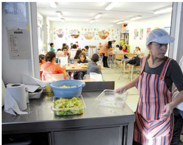
FALTA DE MATERIAL. El centre ha hagut de comprar taules pel menjador