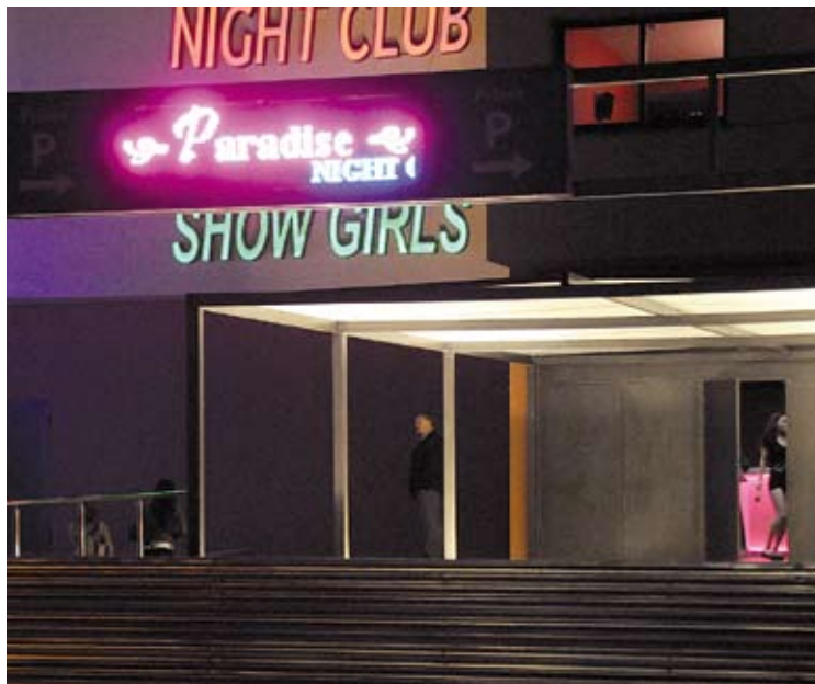
PARADISE. La seva inauguració, dijous al vespre, ha reobert el debat