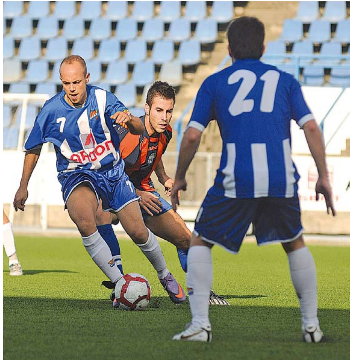
OCASIÓ PERDUDA. El Figueres no va saber mantenir un 0-3 al seu favor i va tornar amb un punt de Gironella

Els figuerencs, molt superiors al primer temps, van topiar amb els pals de la porteria local en tres ocasions. El 3-3 definitiu va arribar en el tram final (87')