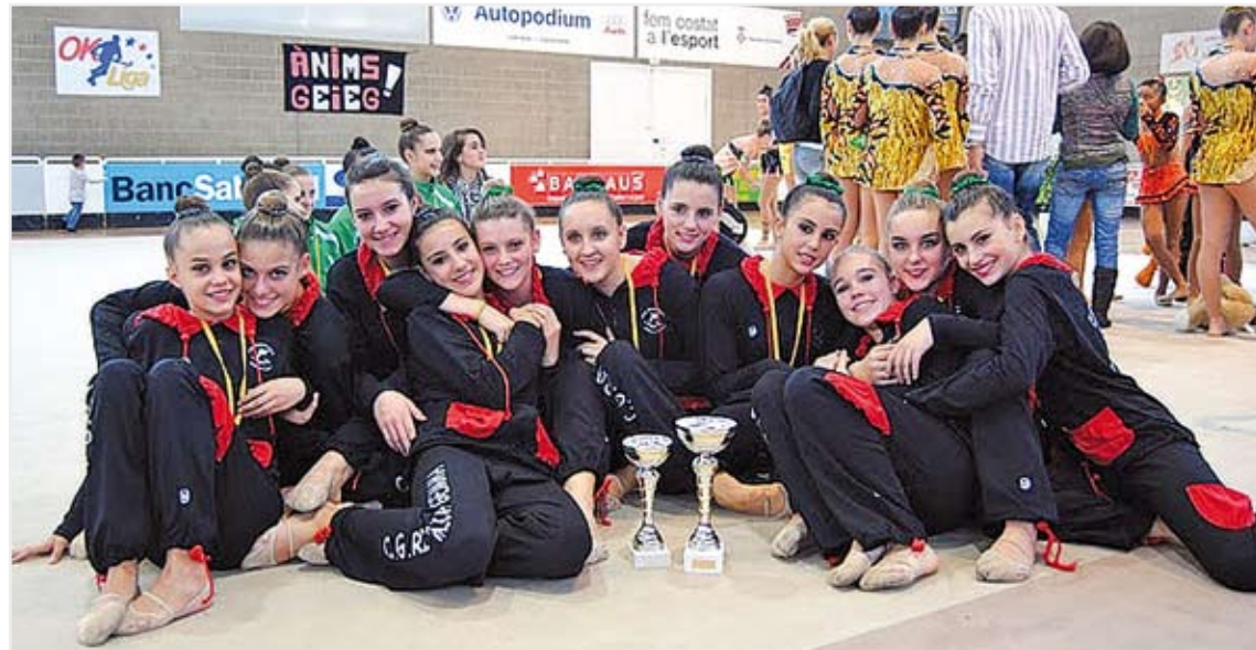
CGR GEMMA. Les components dels dos equips cadets amb els trofeus que van aconseguir dissabte a Girona