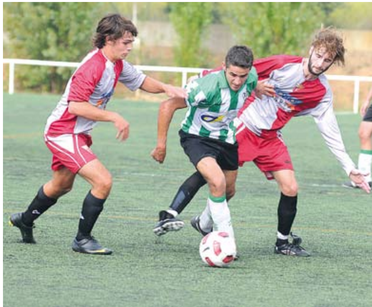
EMPAT. El Base Roses va empatar al camp de l'Esplais