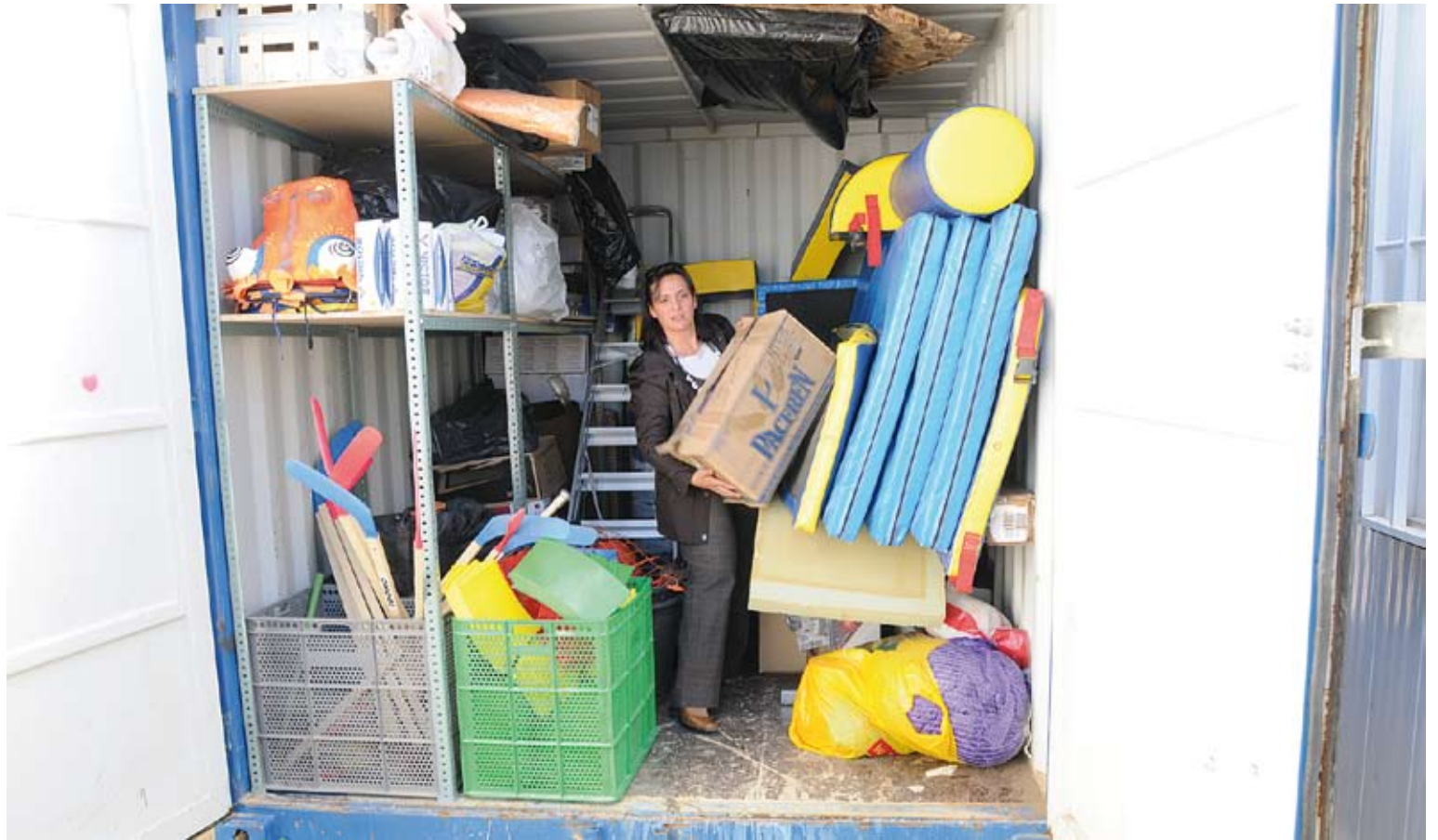
FALTA D'ESPAI. L'Ajuntament ha cedit al centre aquesta caseta de ferro perquè els mestres hi puguin guardar la documentació dels alumnes i material divers

L'equip docent ha hagut de convertir la sala de professors en menjador, perquè no caben al menjador dels nens. I l'equip directiu s'ha vist obligat a aguditzar l'enginy: cada vegada que es col·