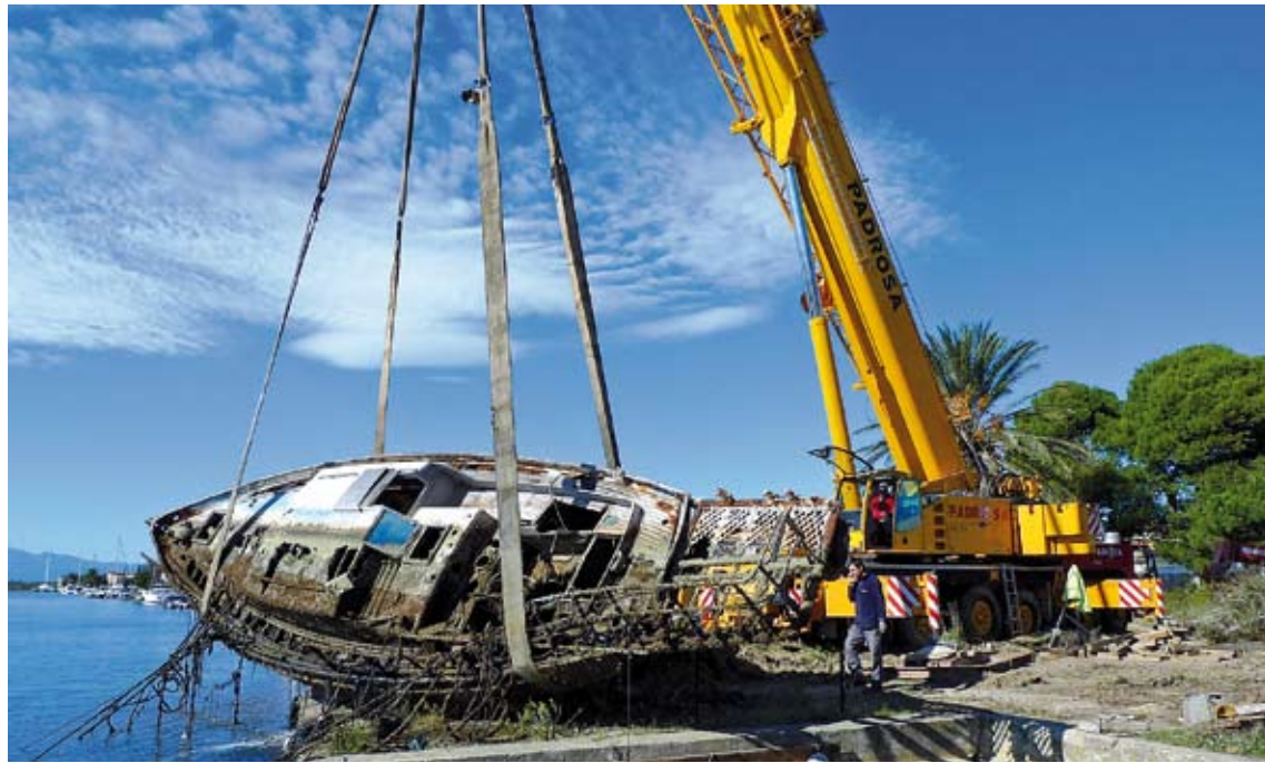
LES TASQUES. Algunes de les barques es van haver de treure amb l'ajuda d'una grua

La realització dels treballs d'extracció s'ha ajustat al termini de tres setmanes previst inicialment per l'empresa adjudicatària. En total, s'han retirat setze embarca-