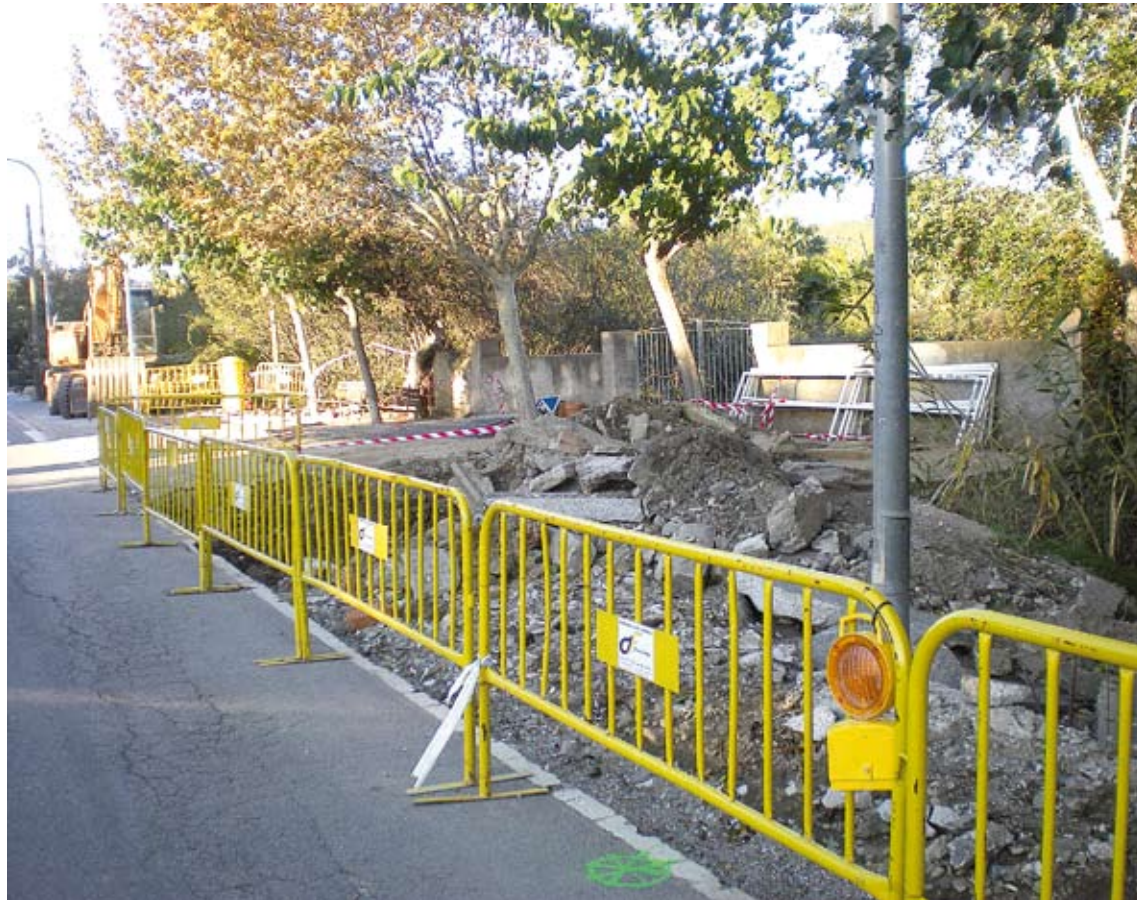
VIAL COMBINAT. En el tram que va de l'Ajuntament a la rotonda del port s'hi combinaran la vorera i el carril per als ciclistes

Vila explica que aquest projecte "és un primer pas del carril bici per connectar la vila i el port, que era una de les coses que havíem proposat". El projecte global -que ja fa temps que està planificat- preveu habilitar un sender al llarg de tota la zona d'hortos, però està encallat per manca de finan-