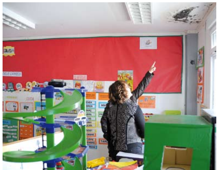
FALTA DE MANTENIMENT. Alguns mòduls tenen filtracions d'aigua