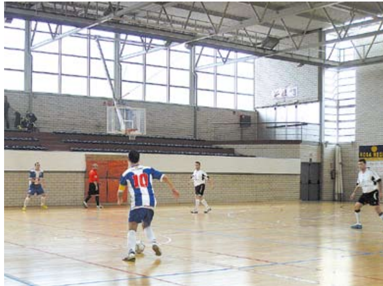
NOVA SAMARRETA. Els figuerencs van estrenar el nou equipament

Quan semblava que la Fundació podria empatar, noves errades defensives van permetre als