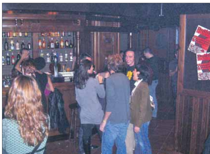
Dues imatges de la inauguració del nou local, situat darrere dels cinemes que va tenir lloc dijous passat amb dos dj's convidats i bona música.