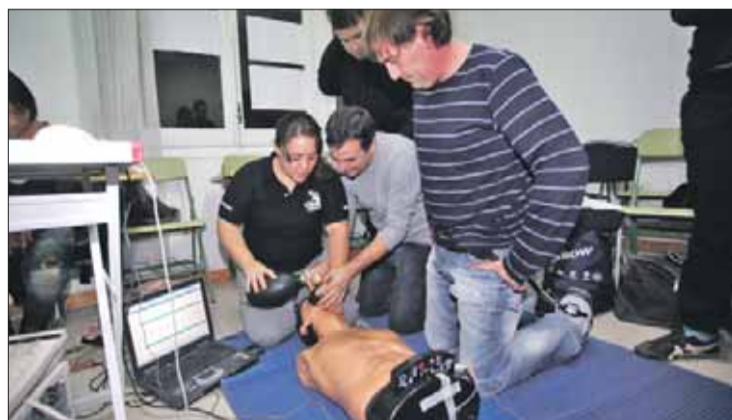
Alguns alumnes del curs de primers auxilis de la Creu Roja. JORDI VELASCO

L'assemblea està negociant amb l'Ajuntament de Roses un