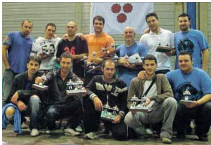
L'equip que va guanyar la segona edició de l'Open. EMPORDÀ

Bai de Feis s'ha marcat l'objectiu d'incrementar les 43 parelles que van participar a l'Open de futbolí