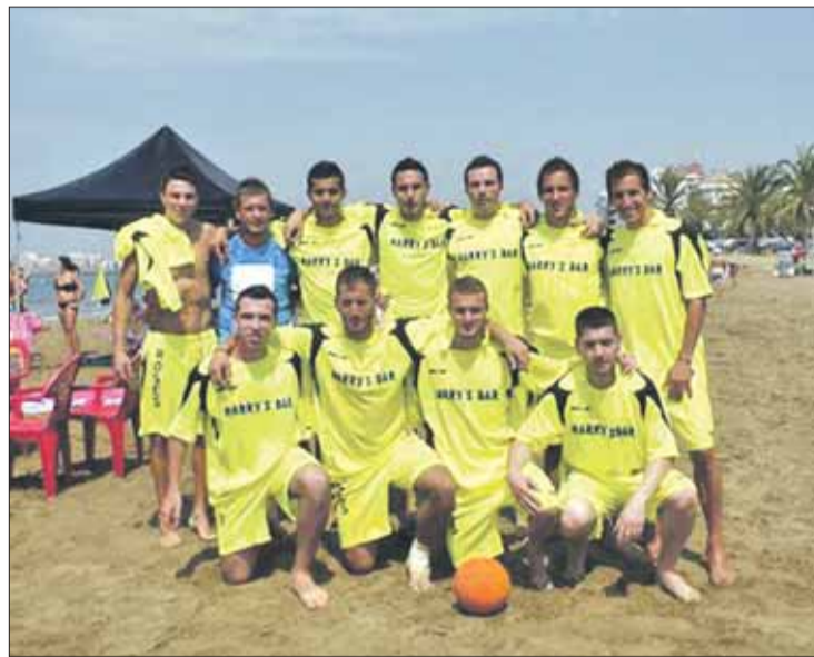
L'equip que competirà amb el CFP Roses. EMPORDÀ

ser rebuts recentment a l'Ajuntament de Roses, institució que ara també els ha assegurat el suport. També treballen per obtenir espònsors.