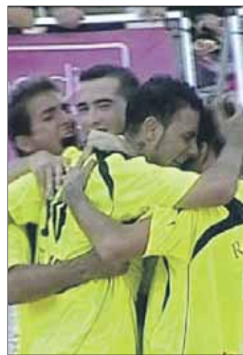
Celebració a Torredembarra. EMPORDÀ

En els propers mesos, el nou club rosinc donarà a conèixer les noves activitats que durà a terme tant per al futbol platja com per a les altres seccions. Durant el proper any 2011, tenen previst muntar torneigs per divulgar aquests esports de platja.