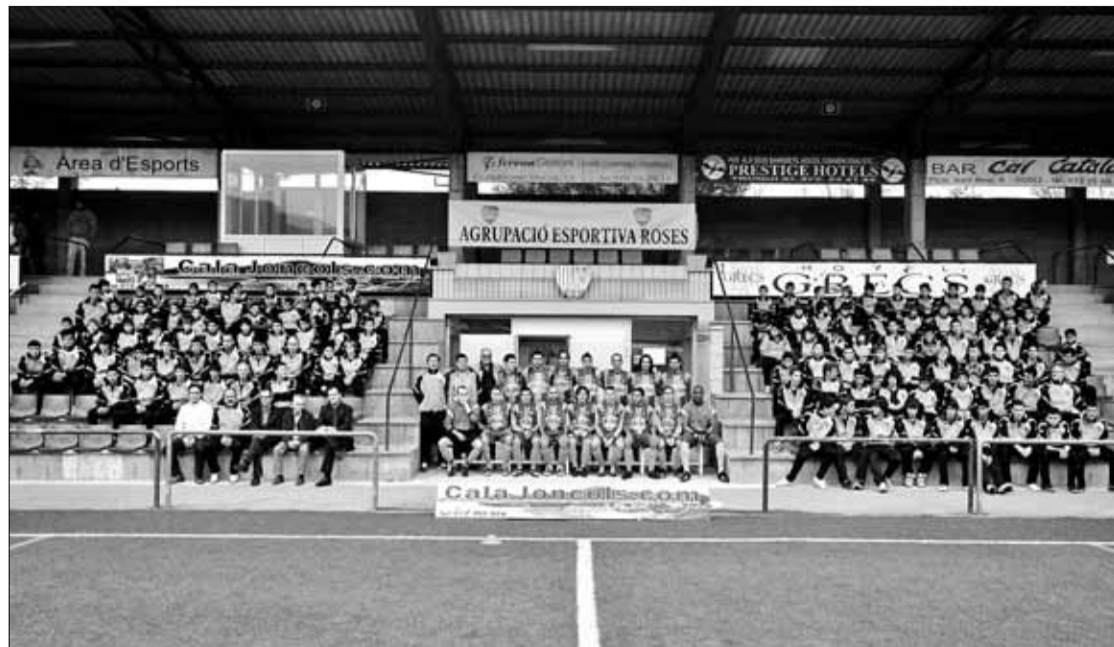
Els equips de l'AE Roses es van presentar diumenge al matí. JORDI VELASCO