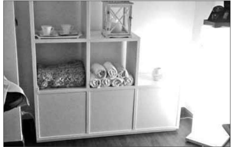
L'espai de relax on es du a terme el massatge. EMPORDÀ

Aquest concentrat vital renovador està format per dos tractaments únics que es fusionen: la crema i les perles