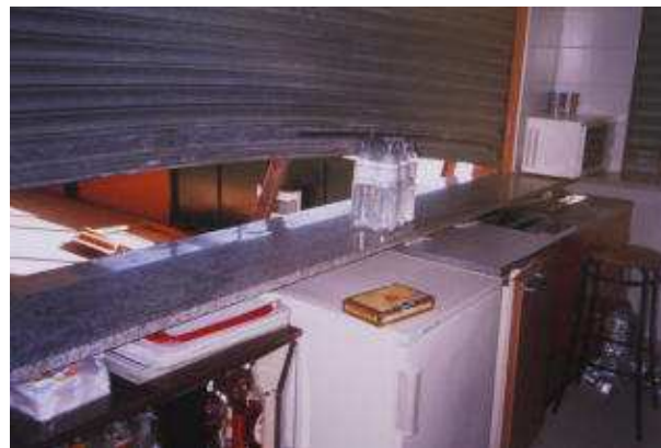
Imatge de com va quedar la persiana del bar del camp de Mont-ras.