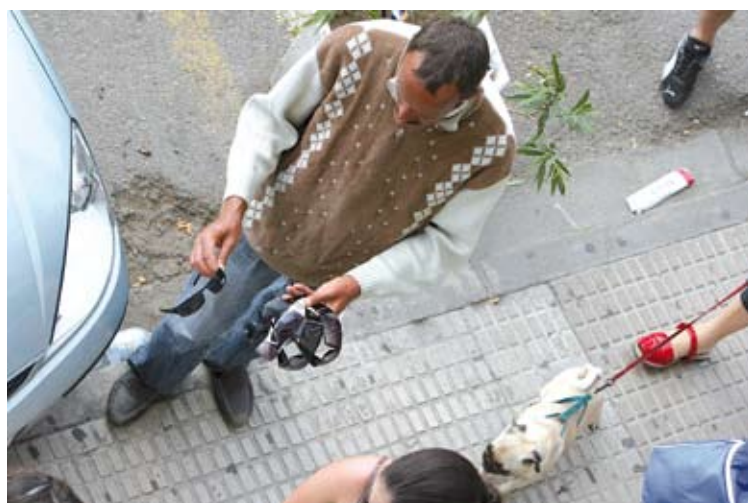
ALLAU DE VENEDORS. La Jonquera i Roses són els municipis més afectats À. REYNAL