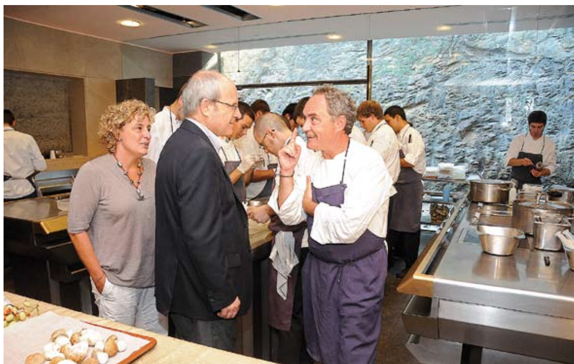
VISITA OFICIAL. A l'estiu, el president de la Generalitat, José Montilla, va visitar El Bulli. A la imatge, amb Ferran Adrià

El fet que El Bulli es trobi dins el Parc Natural del Cap de Creus ha estat un escull a l'hora de tirar endavant aquesta obra. I és que les normes urbanístiques que regulen un espai protegit són molt restrictives, per preservar l'entorn. En aquest cas, el pla director del parc deixa molt clar que les edifi-