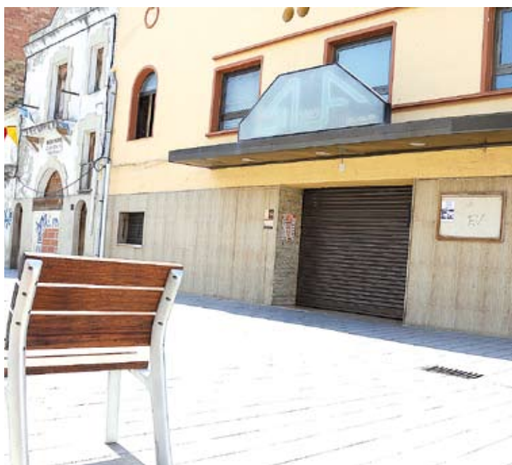
LA SUF. La històrica sala esdevindrà un centre cívic, finançat pel Pla de Barris

El jurat que haurà de triar el projecte guanyador estarà format per un membre de cada grup