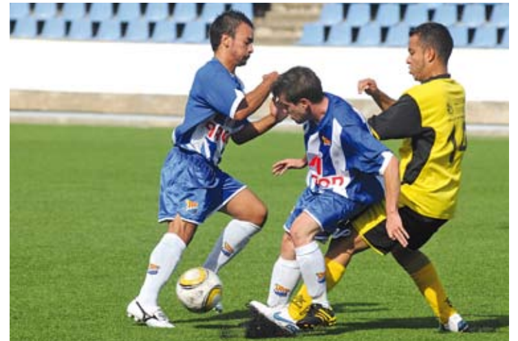
NOU LÍDER. El Figueres B va apallissar el Selvatans i se situa primer