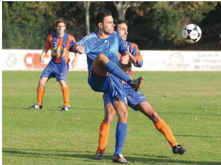
SENSE GOLS. Una acció de l'Empuriabrava-Roses, que va acabar 0-0