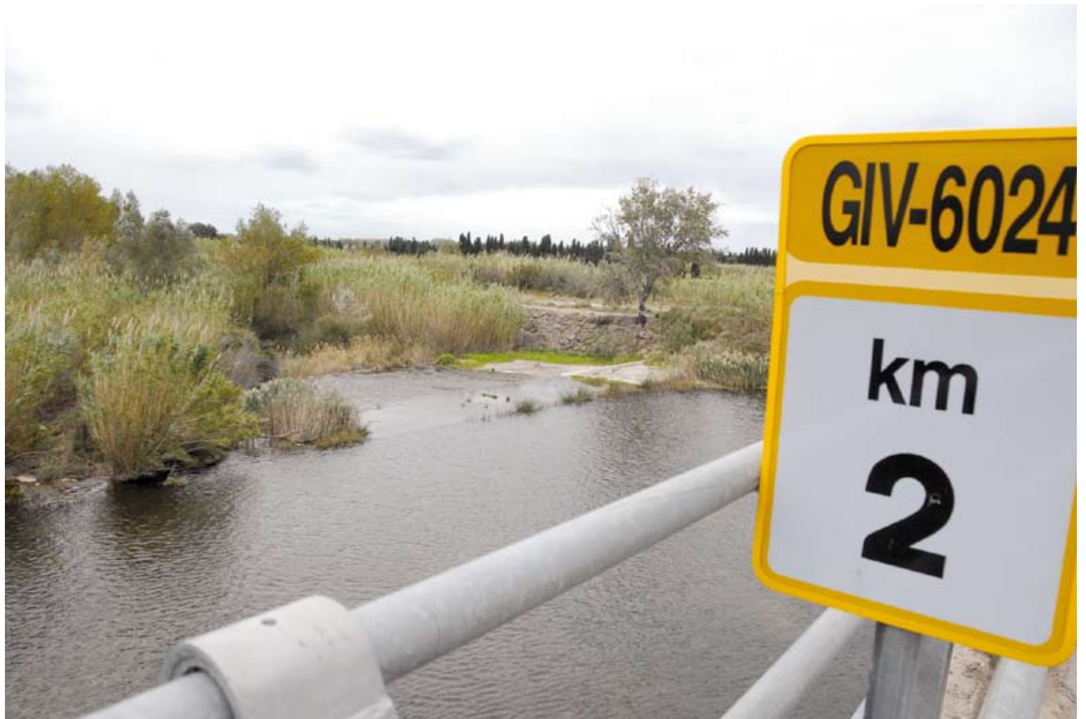
SÈQUIA DE VILABERTRAN. La inversió del Govern beneficiarà els regants de 486 hectàrees de la comarca

Quintana explica que la partida permetrà executar "dues obres per gestionar més bé l'aigua". D'una banda, es construirà una nova canonada entre una bassa que hi ha al Far d'Empordà -i que malgrat fer 15 anys que està construïda actualment encara no s'utilitza- i la sèquia de Figueres 6 (Vilatenim). Serà un canal de 2 km de llargada que donarà servei als agricultors d'unes 70 ha compreses entre el Far d'Empordà i Vila-sacra. D'altra banda, també es muntarà un conducte per reforçar un canal que ja fun-