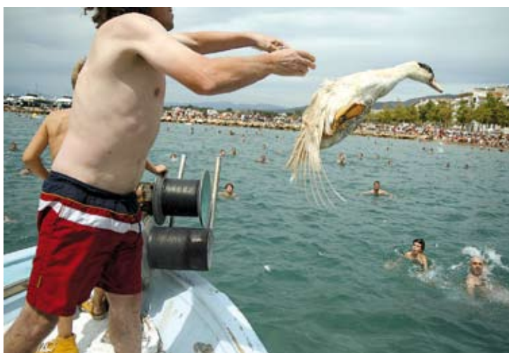
PROTEGIR LA FESTA. Volen que es declari festa local d'interès nacional R. VIDAL