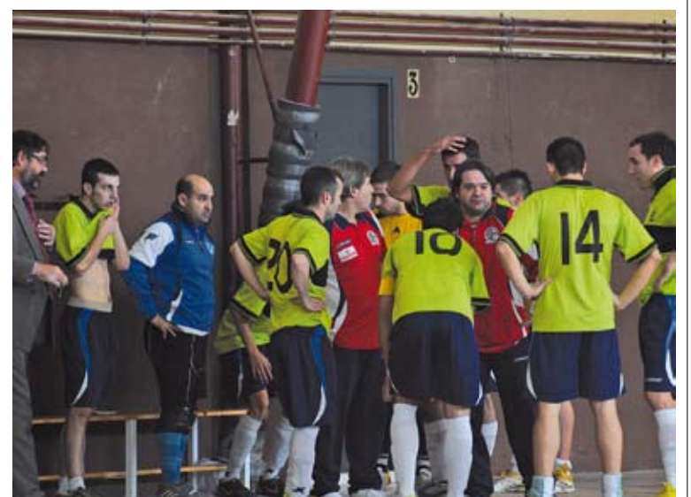
SUPERIORS. Una imatge d'arxiu del primer partit a casa de la FE Figueres