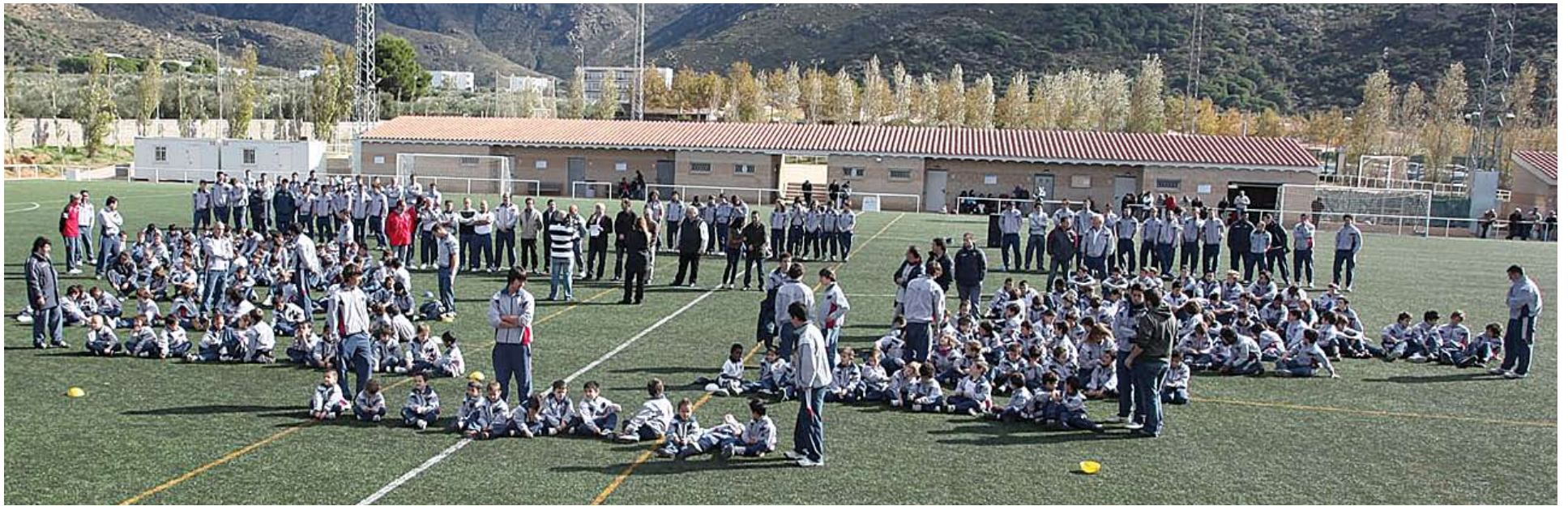
MULTITUDINÀRIA. La presentació dels equips del Base Roses va reunir prop de 800 persones a les instal·lacions de la Vinyassa