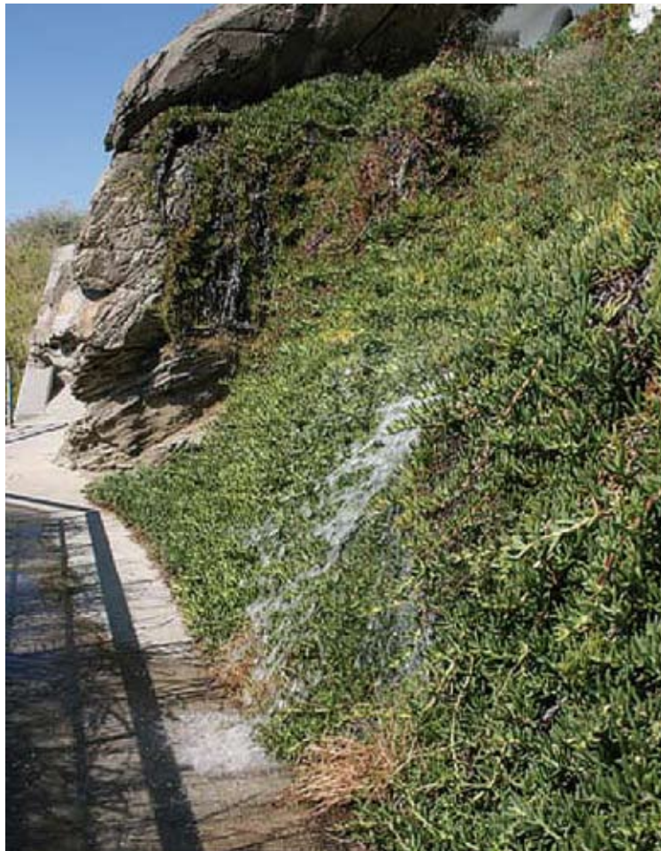
LES FILTRACIONS. Casamitjana assegura que només és aigua de pluja

ca, però és d'aigua de pluja", insisteix l'alcaldesa. Tot i així, ha reconegut que sí que faria falta la construcció d'una canonada per canalitzar aquesta aigua, perquè