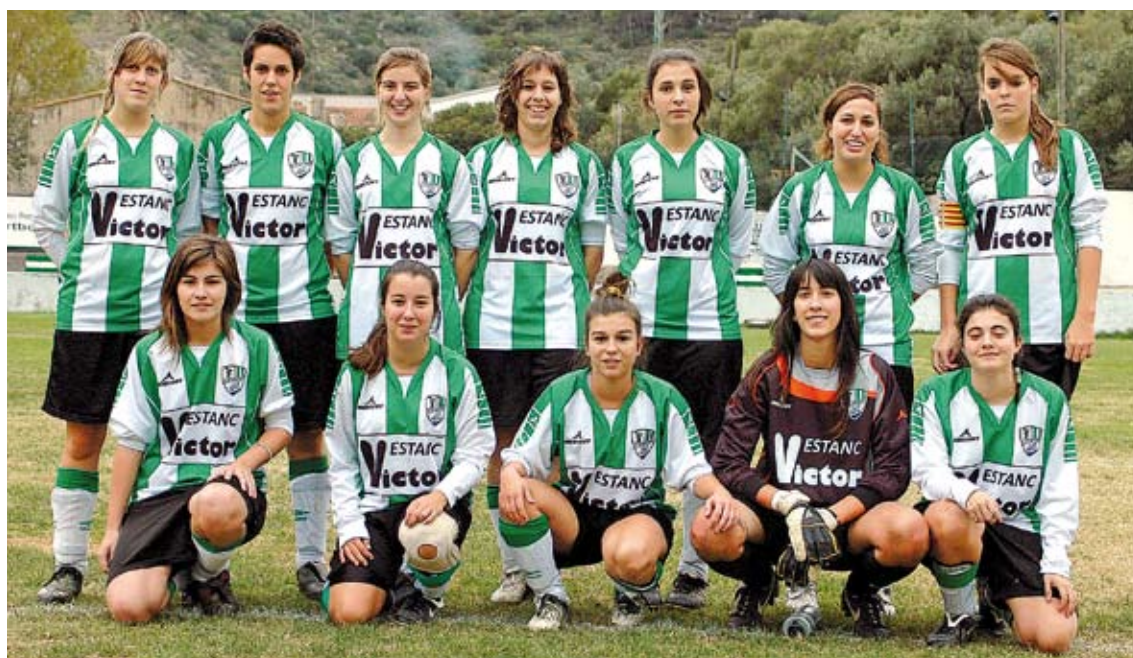
EMPAT MERITORI. L'onze titular del Portbou que va sumar un punt contra el Parroquial Santa Eugènia