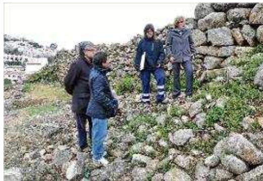
Representants de diverses administracions, en una visita a la zona.

La campanya que es va iniciar aquest estiu ha consistit en tasques de neteja i desbrossament de la zona que ha permès fer visible el perímetre de la muralla de la fortificació i les estructures de les cases que hi havia al seu interior i que ja van ser excavades l'any 1946. En aquests moments, l'equip encarregat del projecte està duent a