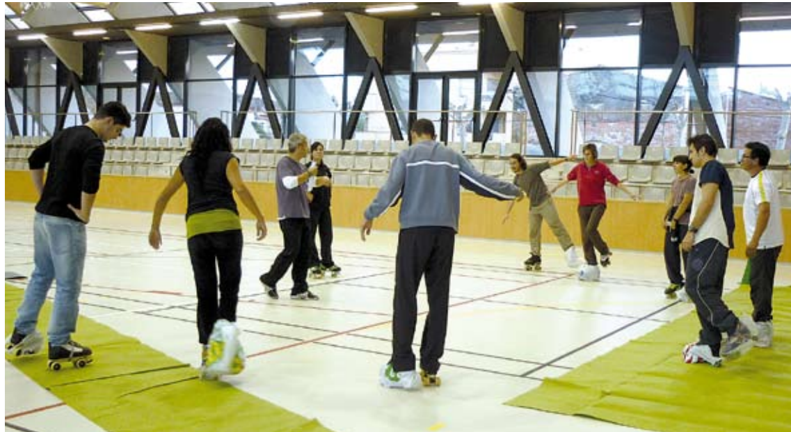
FORMACIÓ. Un grup de participants en una de les activitats organitzades en anteriors edicions de les jornades

En aquesta edició, l'Observatori de l'Esport ha triat la salut com a contingut pràctic, i per aquest