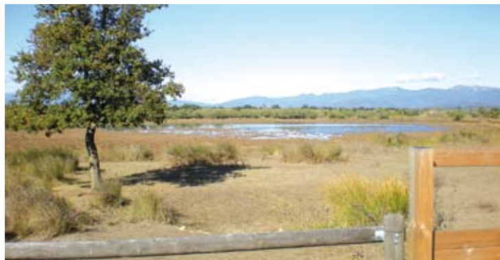
VILAÜT. El centre s'ubicarà als Aiguamolls de l'Empordà

L'escola aprofitarà algunes instal·lacions existents i recuperarà espais de les àrees enderrocades, però també es construiran noves edificacions. Així, l'es-