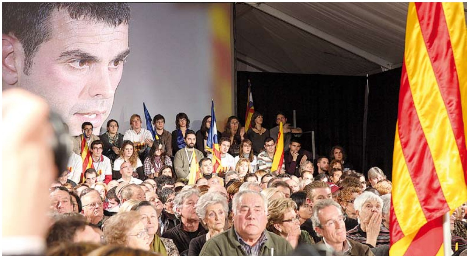
L'ALCALDE A FIGUERES. Dissabte, el candidat de CiU per Girona, Santi Vila, va oferir un míting a la Rambla Nova amb Josep Antoni Duran i Lleida

Aquesta proposta de supressió s'emmarca en el paquet de mesures econòmiques que ha fet la formació per combatre l'actual situació de crisi econòmica. Entre aquestes mesures, Vila va explicar que CiU proposa la revisió dels increments impositius adoptats l'any 2011 pel Govern i que afecten l'impost sobre transmissions patrimonials, l'impost sobre actes jurídics documentals, l'impost de matriculació i l'IRPF.