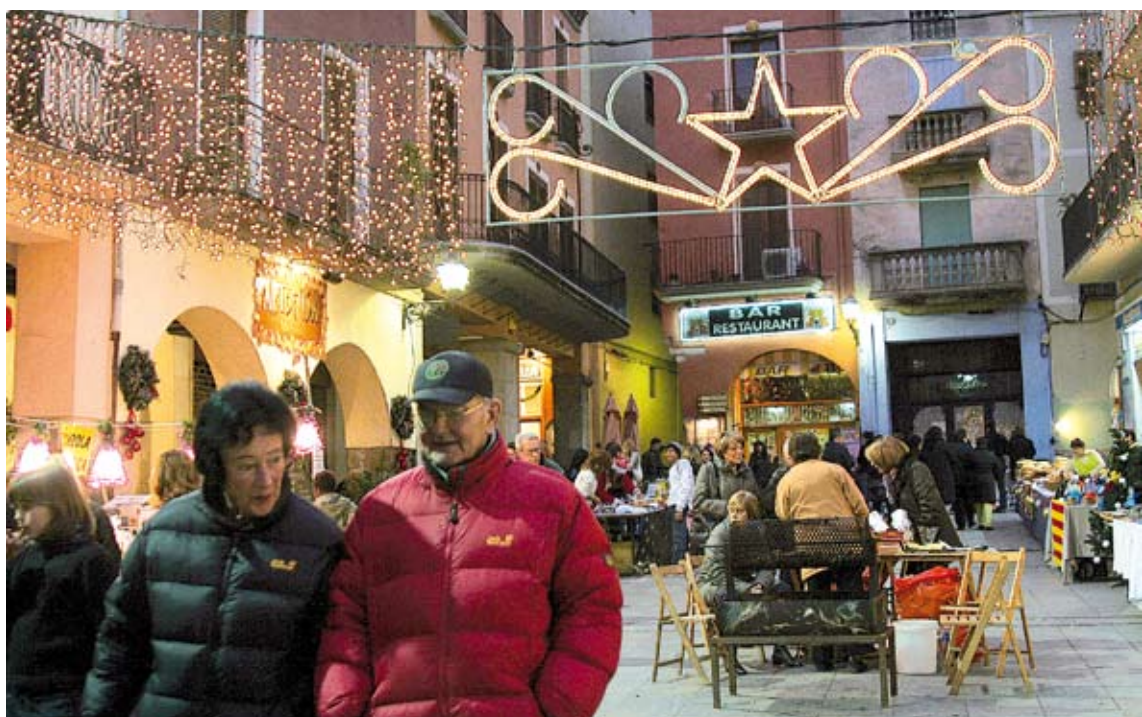
NUCLI ANTIC. Aquest any s'il·luminaran amb motius nadalencs moltes més vies que en anys anteriors