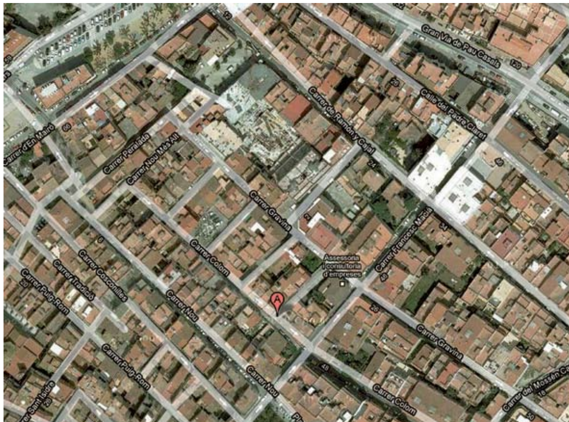
LA ZONA DE COBERTURA. Aquest és un dels grans projectes de reforma del casc antic de Roses

MILLORES DELS SERVEIS. El projecte preveu la substitució de la xarxa d'aigua i de clavegueram, el so-