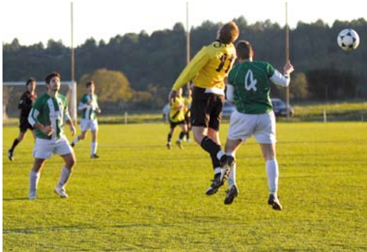
DERROTA. El Llers va perdre el primer partit de la temporada