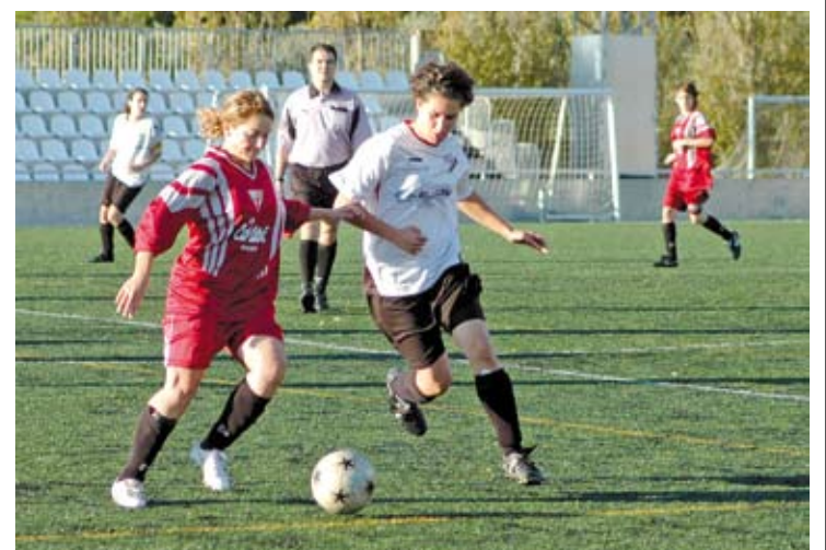
SENSE OPCIONS. El Base Roses va caure a casa contra l'Estartit