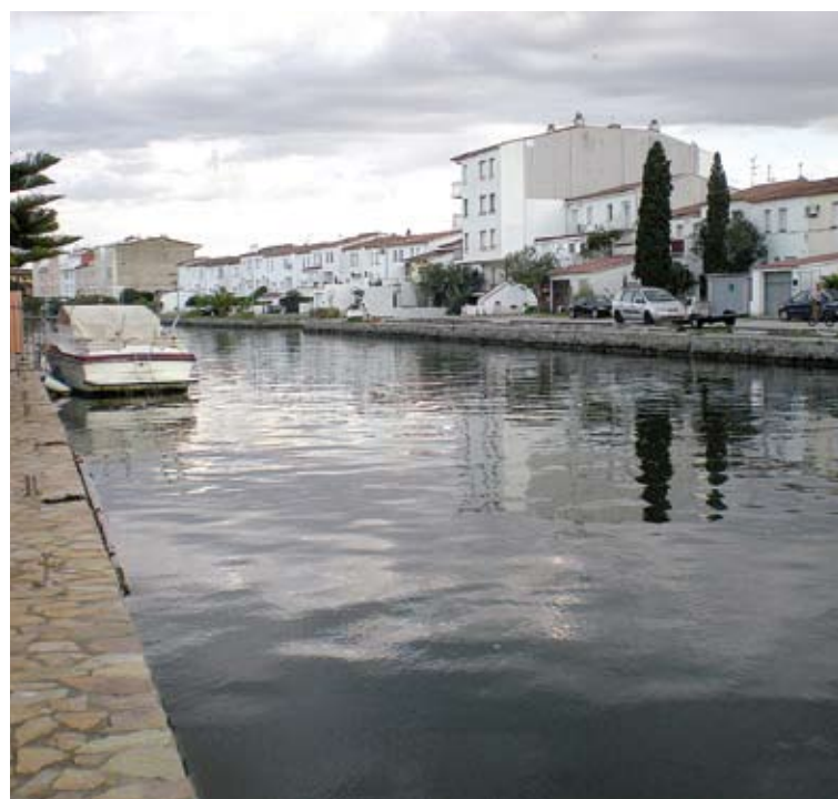
EMPURIABRAVA. Si prosperen les fitacions, les propietats seran públiques