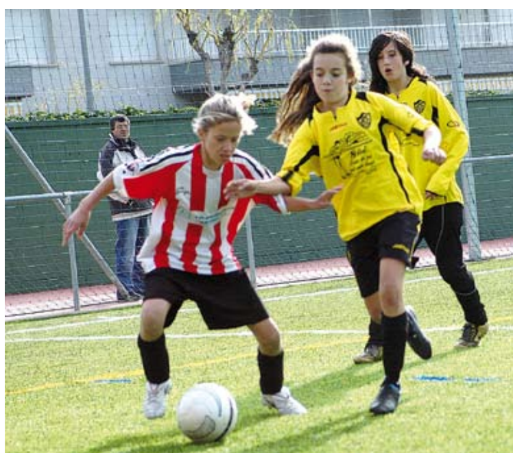
SUPERIOR. L'Estartit va demostrar la seva condició de favorit