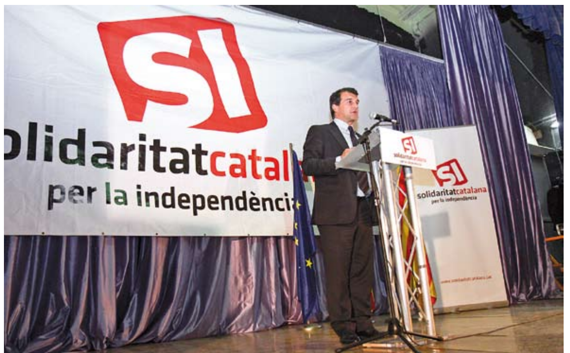
EL CANDIDAT, JOAN LAPORTA. Un centenar de persones van acudir a la SUF de Roses per escoltar el cap de llista de SI

El candidat al Parlament, Joan Laporta, llançar un missatge de tranquil·litat. Va desgranar quins processos s'hauran de seguir a partir de la declaració d'independència i va remarcar que es faria de manera "democràtica i tranquil·la" perquè "estem en el marc de la Unió Europea". Va remarcar que a