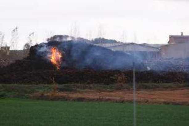
Les tasques d'extinció del foc encara continuaven ahir al migdia. marc martí

MARTÍ SANTIAGO L'incendi que dimecres va cremar 10.000 metres cúbics de troncs d'una empresa forestal de Cassà de la Selva no era un fet aïllat. Dos dies abans els treballadors van evitar que un altre amuntegament de soques s'incendiés de manera semblant en aconseguir apagar les flames inicials d'un petit foc que s'havia declarat per causes desconegudes.