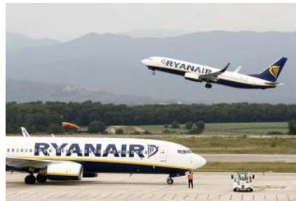
Un avió de la companyia irlandesa s'enlaira des de l'aeroport de Vilobí d'Onyar aquest setembre. aniol resclosa

GIRONA | JOFRE SÁEZ La clau del futur de Ryanair a l'aeroport de Vilobí d'Onyar s'ha de resoldre durant les dues pròximes setmanes. En el cas que no se signi un preacord amb la companyia irlandesa, aquesta pot marxar per sempre més. El motiu que pot propiciar aquest adéu es basa en la pressió de Ryanair per tancar la nova programació d'estiu. No obstant això, des de la Generalitat hi ha la confiança que la signatura d'aquest principi d'acord es pot tancar en els pròxims dies.