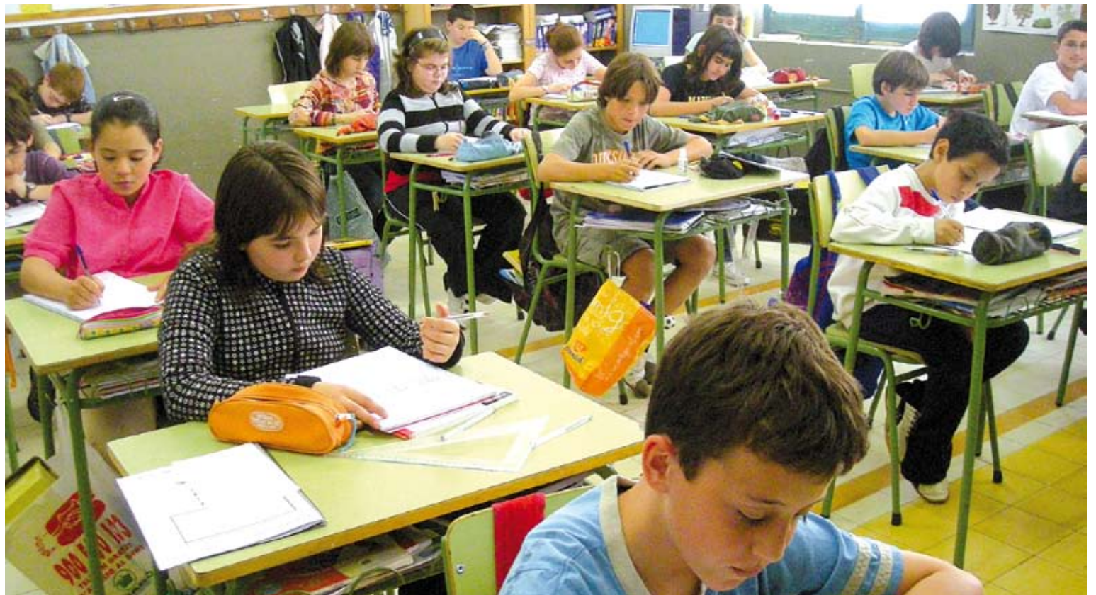
NOVA OPORTUNITAT. Els alumnes que l'any que ve comencin l'institut podrien tenir una titulació vàlida tant a l'Estat espanyol com a França