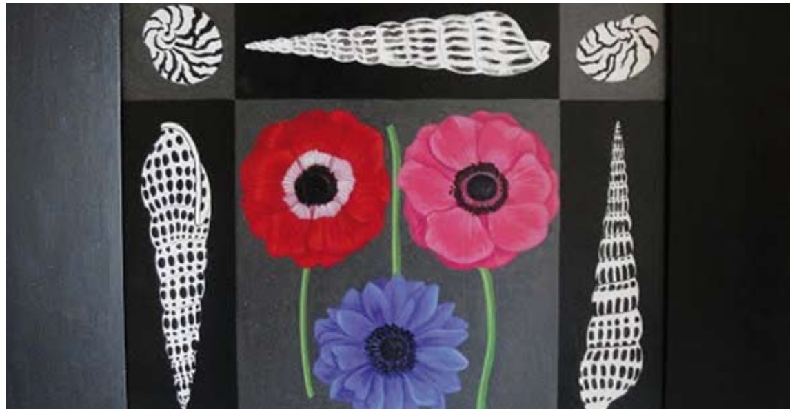
CARME VIARNÉS. Un dels marcs decorats dissenyats per l'artista