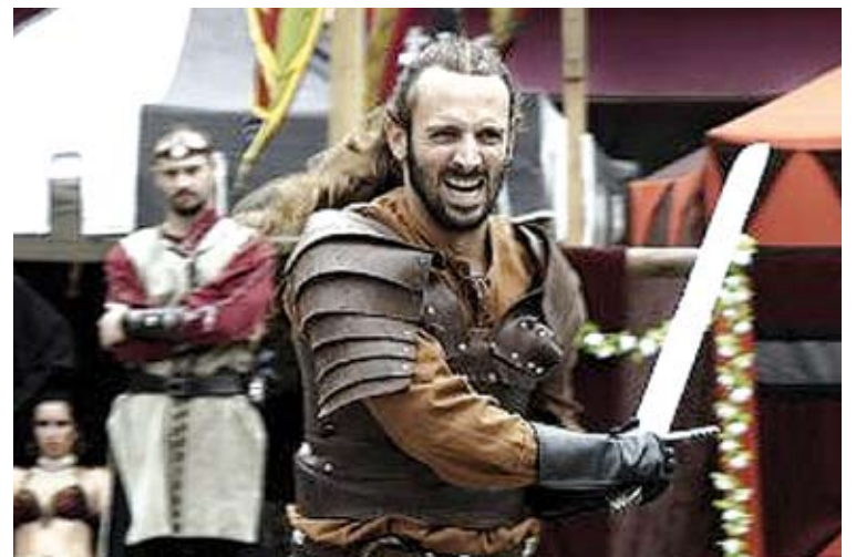
ESPECTACLE. Al castell de Sant Ferran, dissabte

La plaça Josep Pla de Figueres serà l'epicentre d'altres actes com el concert de Los Guardianes del Puente (dissabte, 20 h) o les dotze hores de concerts de clàssica o exhibicions diverses que es faran durant tot diumenge (de 9 a 19 hores). Aquells que vulguin fer esport tenen a Vilafant La marxa a peu per l'entorn del Manol, una