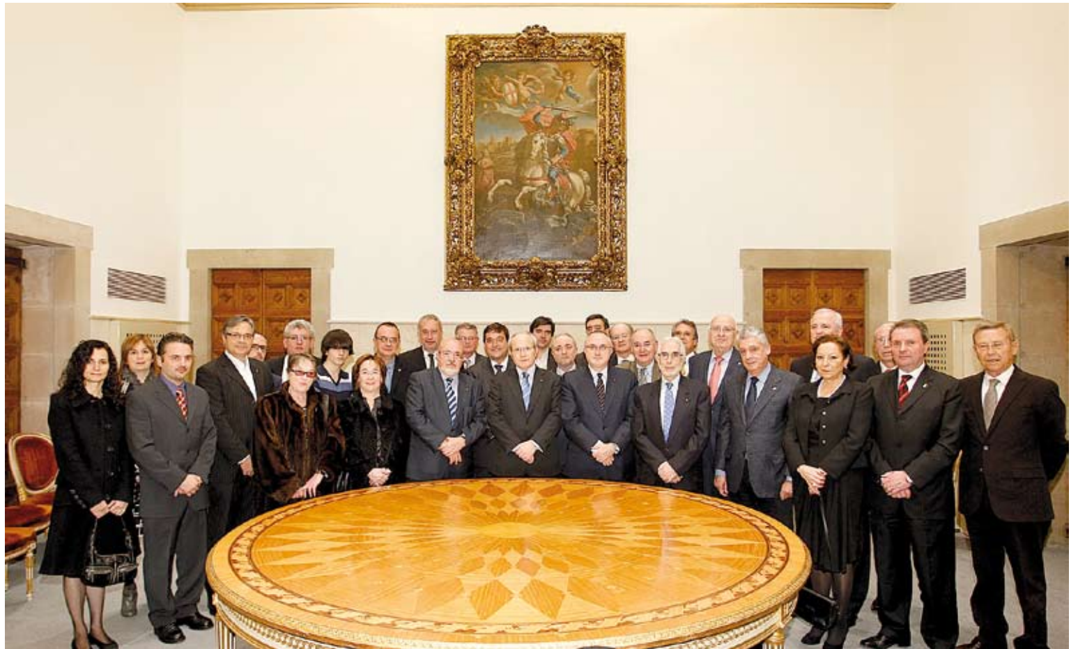
ELS GUARDONATS. Els premiats per la seva implicació en el sector turístic amb el president en funcions, José Montilla

SKYDIVE D'EMPURIABRAVA (DIPLOMA TURÍSTIC). Creat com un centre professional de paracaigudisme fa 25 anys, s'ha convertit en un dels tres millors centres de paracaigudisme esportius del món. Ha fet arribar aquesta pràctica al públic en general, posant-lo a l'abast de tothom. Des del 1989, ha organitzat més de 20 campionats nacionals