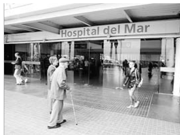
El contagi es va produir l'estiu del 2004, a l'hospital del Mar de Barcelona

ria de l'Ajuntament) i contractada per l'empresa CRC Mar va ser imputada per haver infectat 4 malalts. Segons la investigació, aquesta professional va ser l'encarregada de realitzar-los a tots un TAC i els va injectar per via endovenosa el contrast. ■