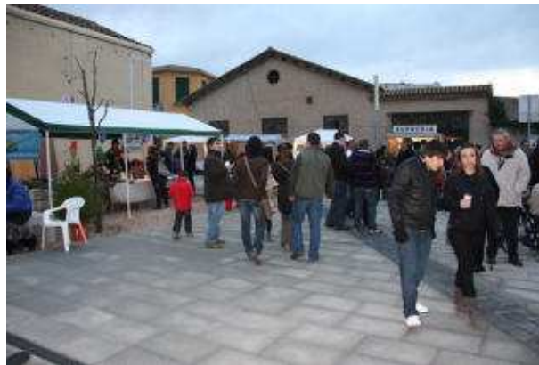
El Mercat de Nadal de Caldes, ahir, en què el terratrèmol va ser el principal motiu de conversa.

JOAQUIM BOHIGAS Un terratrèmol de 3,9 grau de l'Escala de Richter i amb epicentre a Caldes de Malavella (segons l'Institut Geològic de Catalunya) va sorprendre molts gironins de diversos municipis quan passaven pocs minuts de les set del matí (7.08 hores). Bombers i Mossos d'Esquadra, i els mateixos veïns, van confirmar que no s'havien produït danys materials. Els testimonis parlen d'un moviment "sec" i "intens" semblant al xoc d'un cotxe contra una paret o una "explosió", i que va durar escassos segones. Selva i Gironès han estat les dues comarques on el moviment sísmic ha estat més percebut. Algunes persones van sortir al carrer per saber que havia passat.