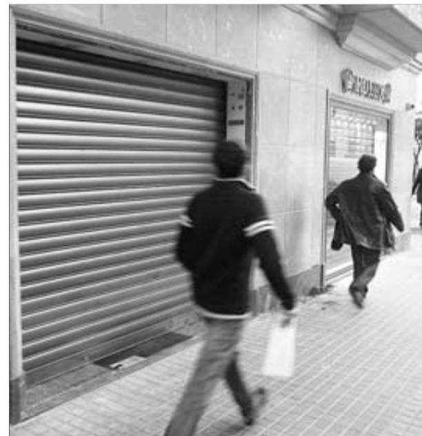
Un jove passa per davant de l'aparador de la botiga ■ O.D.

Els Mossos busquen els assaltants, que van ser enregistrats per les càmeres de la joieria. Sembla que la